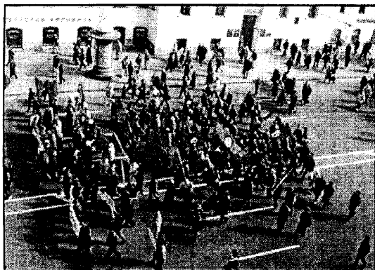
Колонна национал-большевиков на Невском проспекте