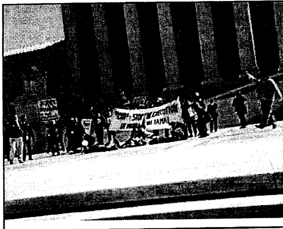
Пикет в защиту Мумии у Верховного суда в Вашингтоне