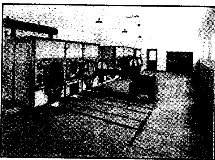
Крематорий концлагеря Бухенвальд