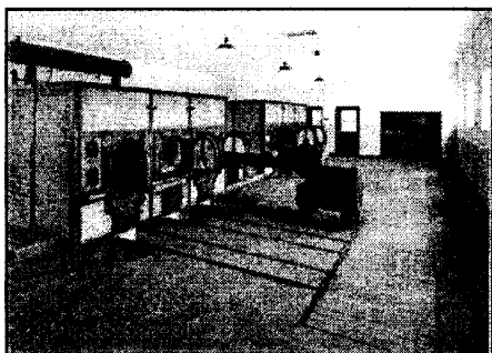
Крематорий концлагеря Бухенвальд