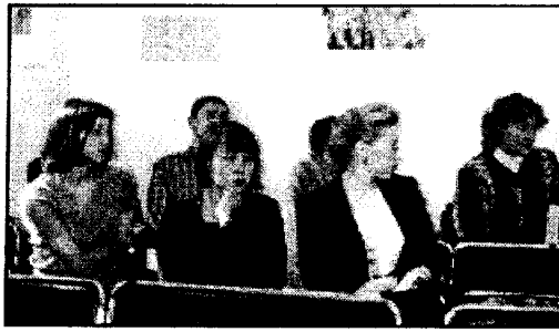
Студенты факультета народов Крайнего Севера РГПУ им. А.И. Герцена