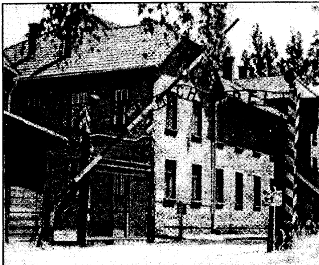
Освенцим. Лозунг на воротах: «Arbeit macht frei» («Работа делает свободным»)

Подавляющее большинство погибших в этом аду — евреи, среди которых были не только мирные граждане, но и военнопленные. Менее трети погибших — граждане других национальностей из разных, как и евреи, стран Европы: люди, сопротивлявшиеся фашистскому режиму, военнопленные, партизаны, те, кто укрывал партизан и военнопленных, ком-