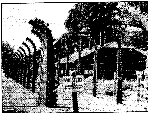
Лагерное ограждение в Освенциме

Для уничтожения европейских евреев существовали и другие лагеря смерти: Майданек, Треблинка, Бельзен и Собибор. Кроме того, было 400 транзитных пунктов, осуществлявших отправку рабочей силы на Запад. Но Освенцим был самой мощной фабрикой смерти и оставался главным центром Холокоста.