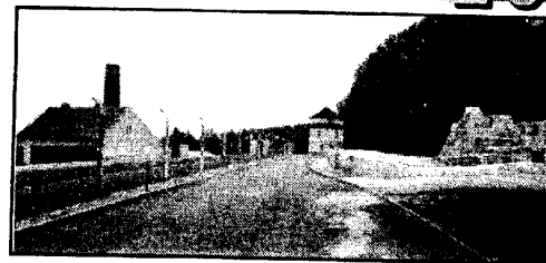
Зоопарк в Бухенвальде

Сколько лет еще существовать этому памятнику? Психологически слишком тяжело там находиться даже короткое время, а что говорить о людях, которые работают в мемориальном комплексе, говорит, что не я одна задаю такой вопрос. Может быть, еще 50 лет это место будет посещаться, пока живы бывшие узники Бухенвальда или родственники погибших. Может быть, потом здесь будет построен новый район разросшего Веймара. Только бы история не повторилась еще раз!