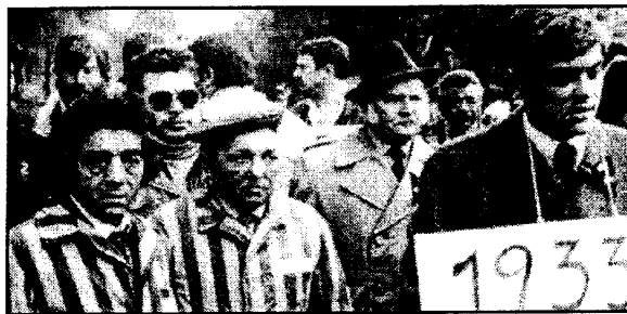
Демонстрация 250 рома и синти перед Федеральной прокуратурой Германии. 1983 год

Петля смерти все туже стягивалась вокруг рома и синти. Операции были спланированы и осуществлялись педантично. Из всех европейских пересыльных лагерей транспорты прибывали в Польшу. Второй по величине польский город Лодзь во время войны входил в состав райхсгау Вартеланд и назывался