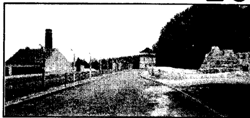
Зоопарк в Бухенвальде