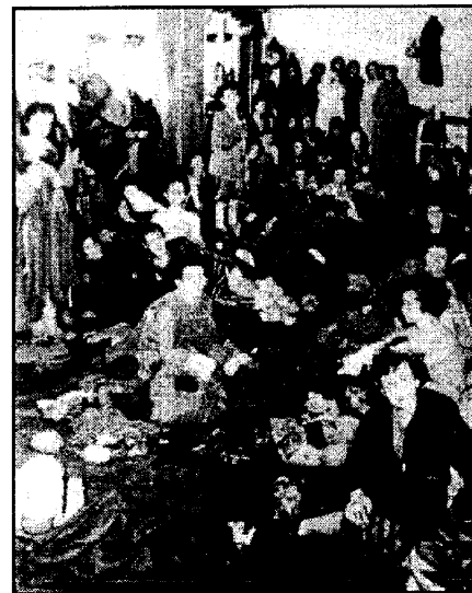
Освобожденные синти и рома в бараке концлагеря Берген-Бельзен

Когда советская армия в 1944 году подошла к концлагерю достаточно близко, «цыганский сектор» был уничтожен. Детей и неработоспособных задушили газом, а оставшихся вывезли в другие лагеря, находящиеся подальше от линии фронта. Эсэсовцы предполагали истребить со временем и их, но, чем ближе был конец Третьего рейха, тем больше охрана концлагерей задумывалась о возмездии. В последние месяцы, выслуживаясь перед будущими победителями, охрана кое-где не выполняла директивы из Берлина о полном унич-