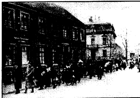
Ремшайд, 1943 год. Депортация рома в Освенцим

Историки Кенрик и Паксон указывают на то, что практические мероприятия правительства свелись к изгнанию — правда, жестокому — цыган из нескольких районов страны,