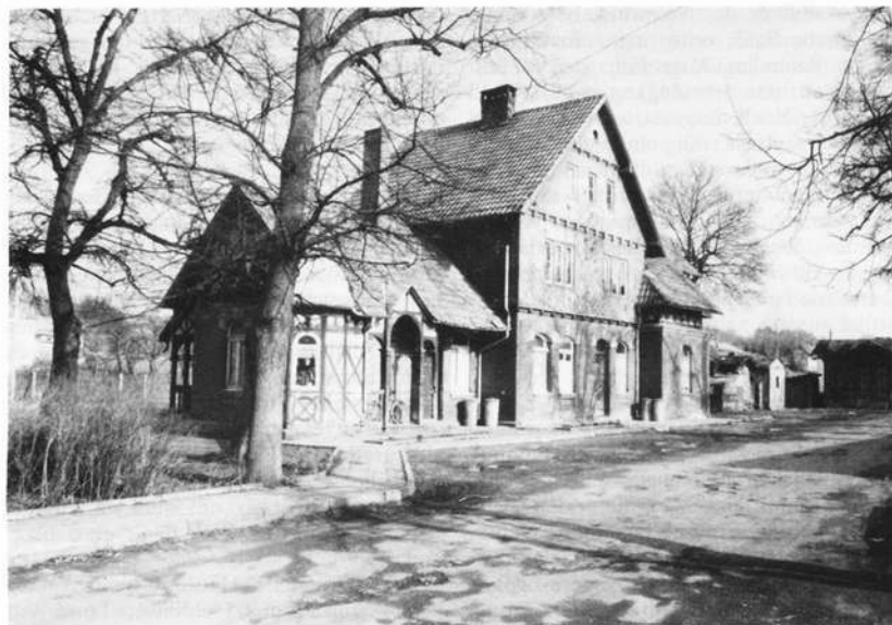
Der alte Bahnhof in Heldburg