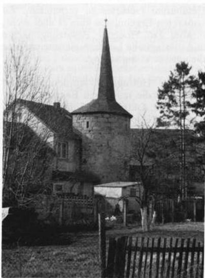
An der Stadtmauer in Heldburg

Nach dem Wiedererwachen des politischen Lebens im Herbst 1946 stellte sich heraus, daß die Bevölkerung bürgerlich-liberale und christliche Kräfte bevorzugte. Die Kommunisten waren im Heldburger Land zunächst eine kleine Minderheit. Allerdings stand die Besatzungsmacht hinter ihnen. Bald wurde auch die Heldburger Region von dem wirtschaftlichen und