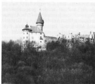
Die Veste Heldburg

Bei Haubinda tritt der Besucher in eine reich gegliederte Kleinlandschaft des Keuperstufenlandes ein: das Tal der Kreck, die mit ihren drei Nebenarmen, der Westhauser, Gellershauser und Gompertshauser Kreck das Heldburger Gebiet durchzieht. Im Süden schließt das breite Bachtal der Helling das Heldburger Land gegen die