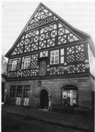
Das Haus Nr. 1 am Häfenmarkt in Heldburg (1605)

An der ausgedehnten, unübersichtlichen Grenze sollte es bald zu kriegsähnlichen Verwicklungen kommen, denn bereits 1923 lagen sich hier sowie im Coburger und Kronacher Raum die proletarischen Hundertschaften der Thüringischen Volksfrontregierung und Freikorpsverbände aus Bayern schußbereit gegenüber. 12) Niemand konnte damals ahnen, daß die Bürgerkriegswirren der frühen Weimarer Republik, die auch in den fränkisch-thüringischen Grenzraum hineinwirkten, nur die Vorboten einer weitaus gefährlicheren Konfrontation waren.