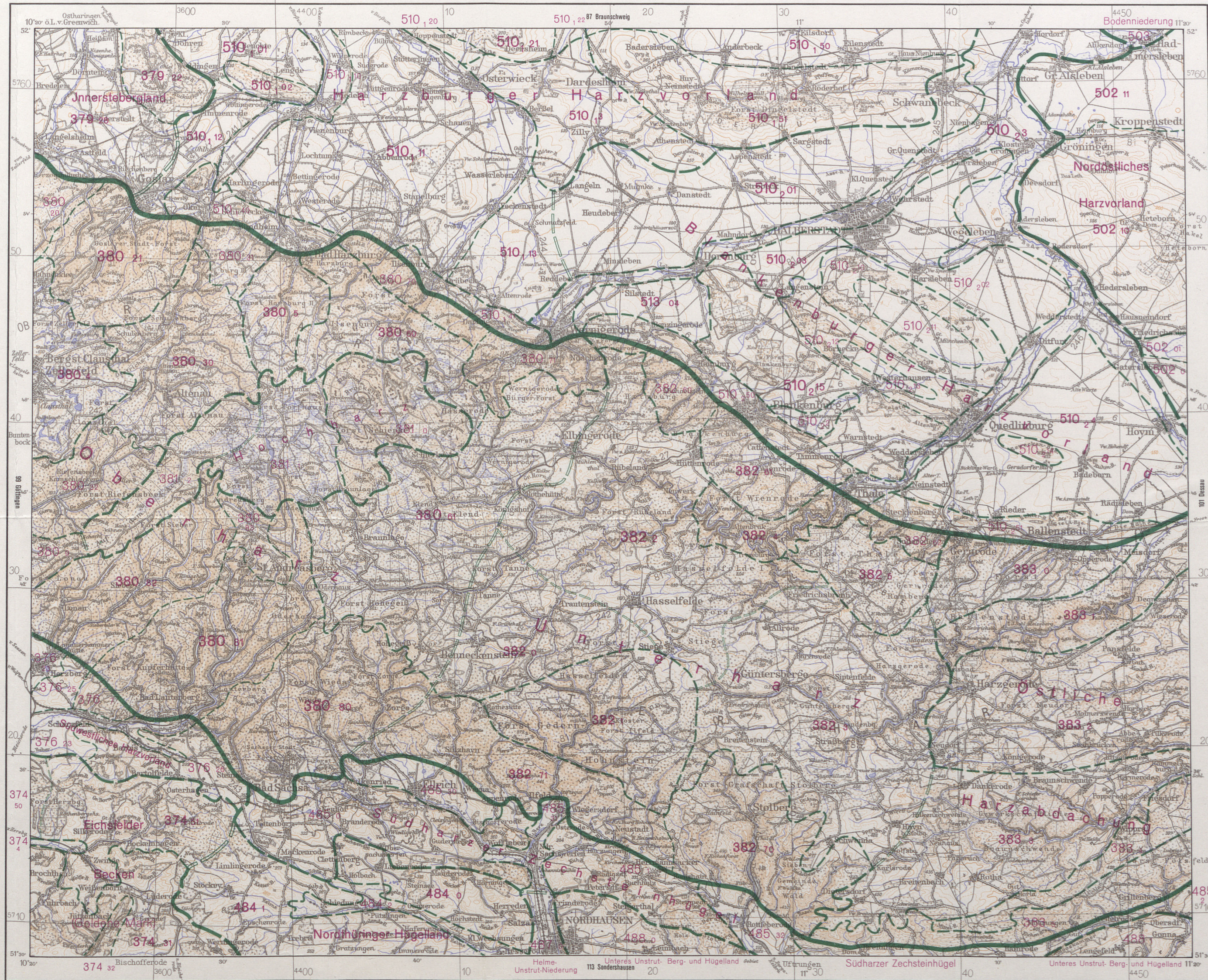
Geographische Landesaufnahme 1 : 200000 Naturräumliche Gliederung, Bl. 100 Halberstadt, Bearbeitung abgeschlossen: Dezember 1969

Grundlagen: Topogr. Übersichtskarte des Deutschen Reiches 1:200 000 mit Genehmigung des Instituts für Angewandte Geodäsie, Frankfurt a. M., Nr. 14/69 vom 5. 11. 1969