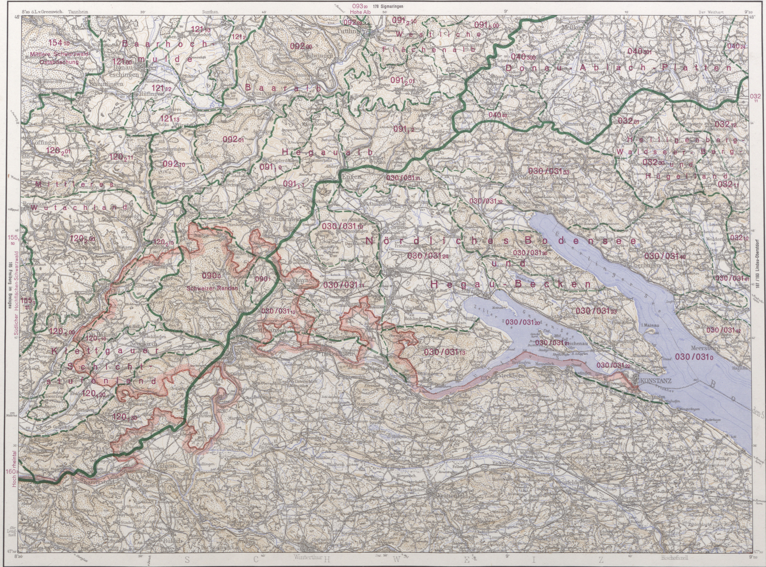
Geographische Landesaufnahme 1: 200 000 Naturräumliche Gliederung, Bl. 186 Konstanz, Bearbeitung abgeschlossen: November 1964

Grundlagen: Topogr. Übersichtskarte des Deutschen Reiches 1: 200 000, mit Genehmigung des Instituts für Angewandte Geodäsie, Frankfurt a. M.