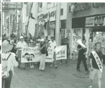
商店街では笑顔でアピール