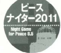
▲監督・選手がつけてプレーしたワッペン