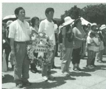
慰霊碑に献花・黙祷