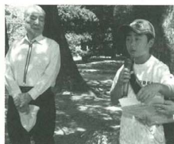
話し合いで解決を！ 子どものメッセージ