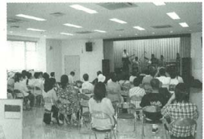
▲平和のつどい 因島コンサート