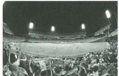
▲3万人がポスターを掲げてアピール

〈主催:広島東洋カープ、広島平和文化センター、広島電鉄、中国新聞社、生協ひろしま〉