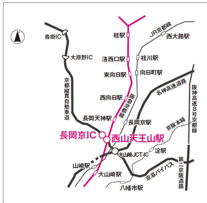
「西山天王山駅」 設置場所 位置図