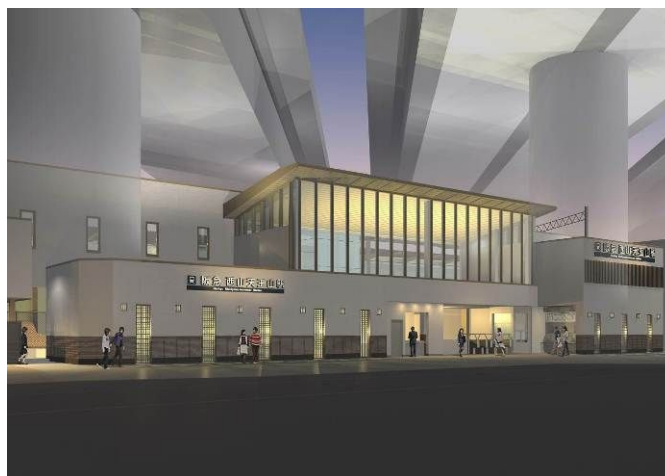
「西山天王山駅 駅舎（下り線側）夜間外観イメージ」