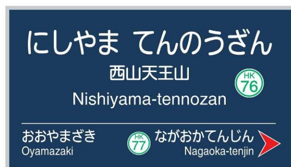
「西山天王山駅 駅名看板イメージ」