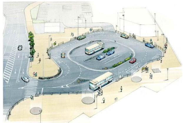
「東側駅前広場イメージ」