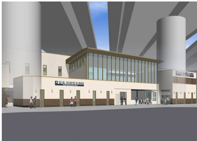
「西山天王山駅 駅舎（下り線側）昼間外観イメージ」