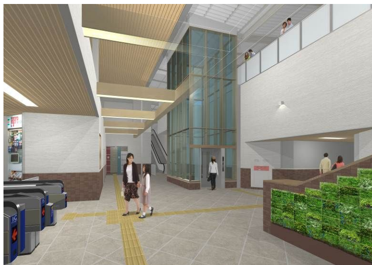
「西山天王山駅 駅舎（下り線側）構内イメージ」