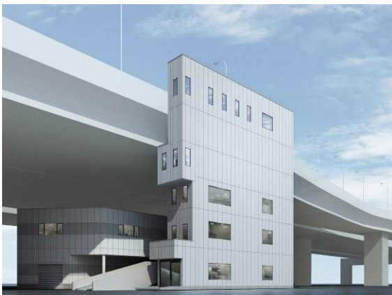
「高速バスストップ(上り) 接続エレベーターイメージ」