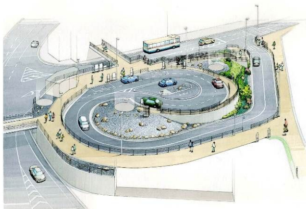
「西側駅前広場イメージ」