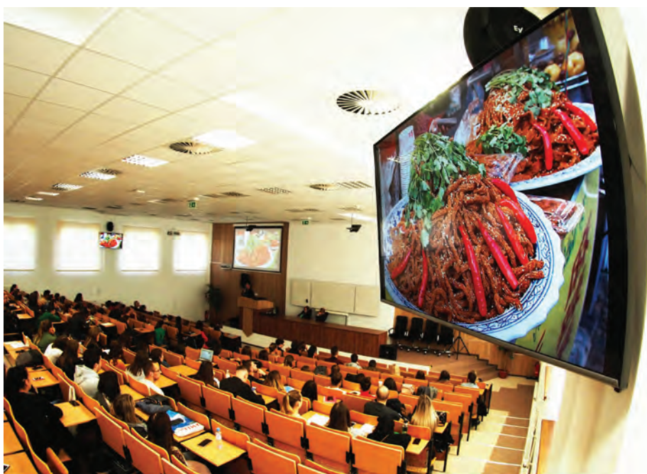
Foto: PaedDr. Július ALCNAUER, Ph.D. RNDr. Jana MITRÍKOVÁ, Ph.D. FM PU