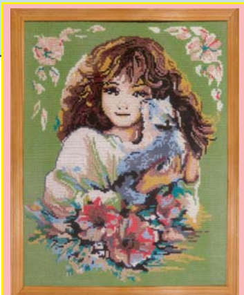
Олена Микитенко. Дівчинка з котиком. Художня вишивка. Фото Василя УСТИМЕНКА.