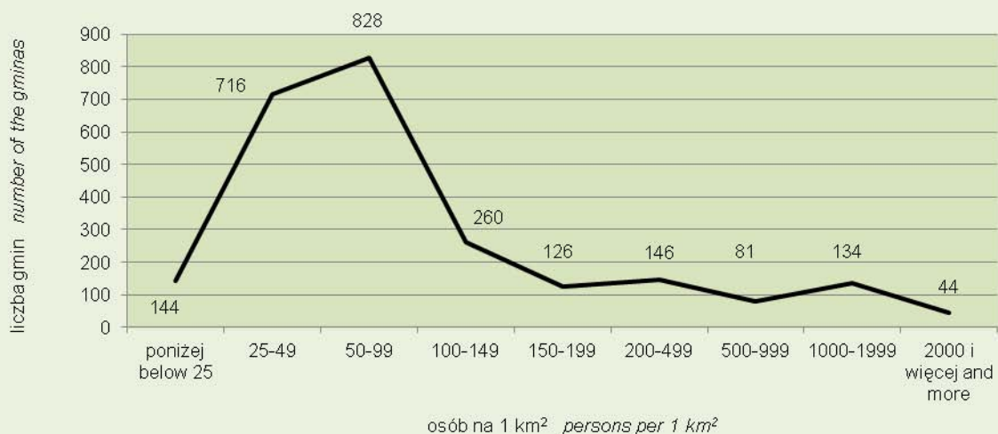
Wykres 2. Rozkład gmin według gęstości zaludnienia Graph 2. Gradation of gminas by population density

Buczkowice w pow. bielskim, woj. śląskie są gminą wiejską o najwyższej gęstości zaludnienia (566 osób/km 2 ), a Wołomin w pow. wołomińskim, w woj. mazowieckim najgęściej zaludnioną gminą miejsko-wiejską – 835 osób/1 km 2 . Najmniej – 4 osoby przypadają na 1 km 2 w gminie wiejskiej Lutowiska w pow. bieszczadzki, woj. podkarpackie. Kolejne jednostki o wartości wskaźnika poniżej 10 osób/1 km 2 to: Cisna w pow. leskim także w woj. podkarpackim, Płaska w pow. augustowskim i Giby w pow. sejneńskim, obie w woj. podlaskim oraz Nowe Warpno w pow. polickim, woj. zachodniopomorskie. Jest ono także najrzadziej zaludnioną gminą miejsko-wiejską. Gmina miejska o najniższej gęstości zaludnienia to Krynica Morska w pow. nowodworskim, woj. pomorskie (12 osób/1 km 2 ).