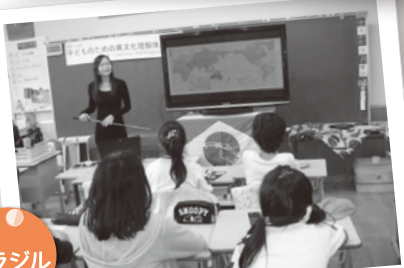
ブラジルから日本に来るとき、 飛行機で30時間かかりました(汗)