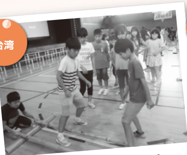
台湾のバンブーダンス! 上手くりズムに乗れたかな?