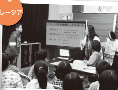
マレー語で 簡単な会話に挑戦!