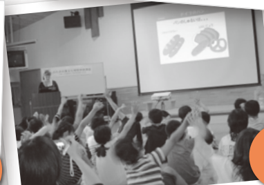
ドイツには、パンが100種類以上も あるんですよ!!

平成29年度も、各小学校の授業時間内にこの出前講座を実施する予定です。公募により決定した小学校と財団とで事前に打合せをして、日程や講座の内容等を調節します。また、講座にかかる費用は当財団が負担します。是非、授業の一環としてご活用ください! 募集は5月頃より開始する予定です。