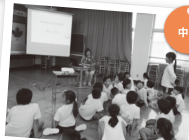
中国について気になることを質問中。 講師も丁寧に答えます。