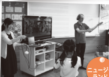
手作りのポイを使って、 マオリ族の踊りにチャレンジ!