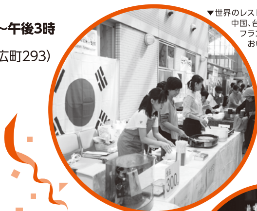
▼世界のレストラン：韓国、フィリピン、中国、台湾、タイ、インドネシア、フランスなど… おいしい料理満載♪