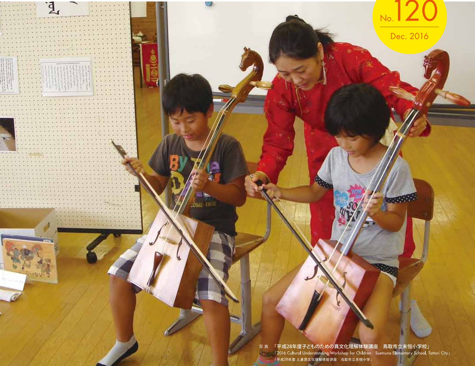
写真 「平成28年度子どものための異文化理解体験講座 鳥取市立末恒小学校」 「2016 Cultural Understanding Workshop for Children Suetsune Elementary School, Tottori City」 「平成28年度 児童異文化理解体験講座 鳥取市立末恒小学」