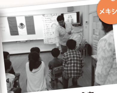
メキシコのお金を 実際に触ってみました!