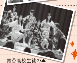
青谷高校生徒の▲ダンス披露

生徒たちは主に英語でジェスチャーを交えコミュニケーションを取っていたようですが、中国、韓国の生徒の中には数名、簡単な日本語を話す生徒もあり、楽しく交流できたとのこと。12月には青谷高校の生徒4名(希望者)が居昌中央高等学校を訪問し、現地の授業等を体験する予定です。また、1月下旬にはブラジル松柏学園と隔年で実施している交流会が予定されています。交流事業は来年も行われます。