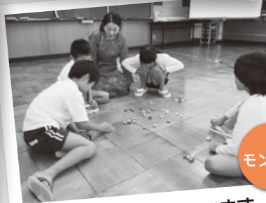
「シャガイ」で遊んでいます。 さて、「シャガイ」って何でしょう?