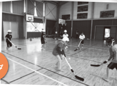
ホッケー体験。 初めて持つスティックに苦戦しながらも、 ゴールが決まるたびに大騒ぎでした!