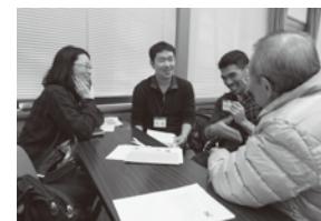
▲英語によるロールプレイで実践練習!