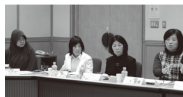
▲多文化共生ネットワーク推進会議の様子