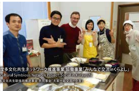
写真 平成29年度多文化共生ネットワーク推進事業 協働事業「みんなで交流inくらよし」 2018 Multicultural Symbiosis Network Project: Social in Kurayoshi 平成29年度多文化共生ネットワーク推進事業 共同事業「大家一起交流in倉吉」