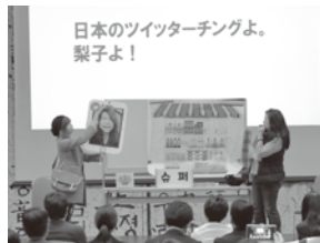
▲一般スキット部門