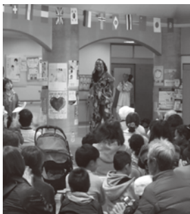
▲ジャマイカ・ミニコンサート