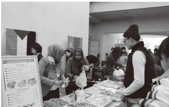
▲スーダン:スパイスの効いたチキンサンドイッチが大好評!