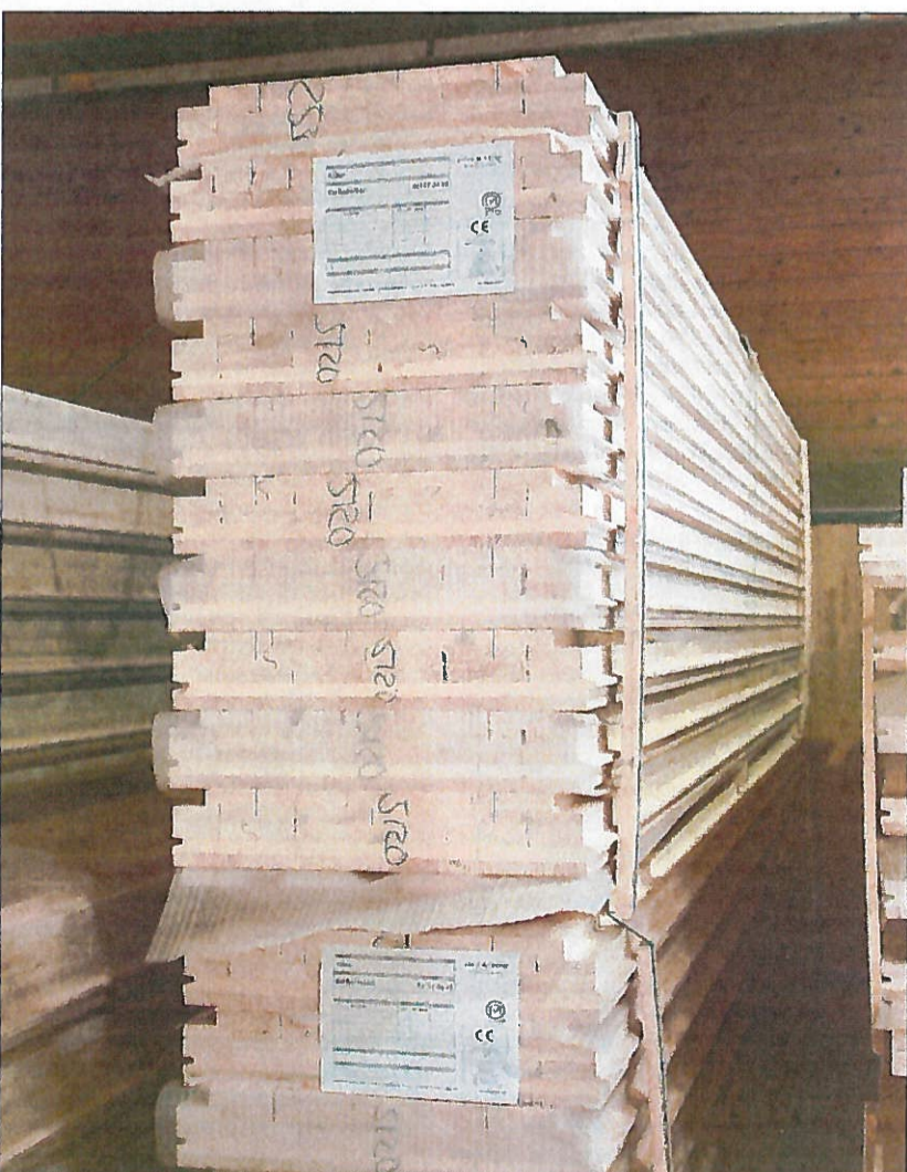
Aufgestapelte Brettspertholz-Elemente aus Weißtanne