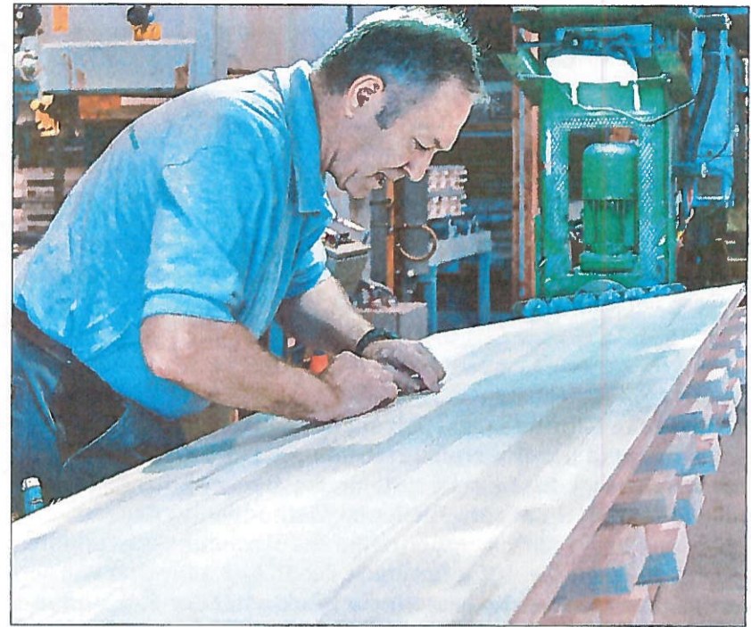
Ein Prüfer kontrolliert die Qualität einer astfreien Deckplatte für ein Brettspertholz-Kastenelement.

Insbesondere flächig verarbeitete nahezu astfreie natürlich belassene oder gewachste Tannenholzoberflächen entfalten eine edle Anmutung durch ihre