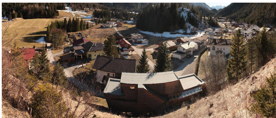
Abb. 3: Biberwier, Ortsteil Rauth, Blickrichtung Süden (Februar 2014). Rechts die Talung des Dorfbachs, links an der Brücke der Loisachknick Rauth. Das Tal zwischen dem Aufnahmepunkt und dem gegenüberliegenden Tomahügel ist mit fluviatilen Sanden und Kiesen gefüllt und wird von einem Graben zur Loisach hin entwässert.

Im Verlauf der Loisach fallen zwei Charakteristika auf: der Fluss knickt einmal vor einem Murkegel nahe dem Sportplatz abrupt nach Südosten ab und wenige hundert Meter in dem gedachten weiteren Verlauf findet sich ein Trockental, das dem vorherigen Verlauf entspricht und nach etwa 500 m den Verlauf des Dorfbaches vorzeichnet. Wie bei der Geländestufe der Loisach an der L391 fällt das Trockental auf weniger als hundert Metern von 1020 auf 1005 müA ab. Schuch (1981) hat dort bis 1002 müA eine 18 m mächtige Ton-Schluff-Abfolge erbohrt (Bohrung 1), die er als dünnen Gehängeschutt über Grundmoräne deutet. Die Schluff- und Sandlagen könnten glaziofluviale Ablagerungen, Murablagerungen sowie Ablagerungen des Fernpassbergsturzes darstellen. Das Grundwasser stand bei 1017 müA. Weitere Aufschlussbohrungen des Verfassers erbohrten im Trockental gleichartige Sande und Schluffe sowie einen von 1008 müA bis 1006 müA nach Norden abfallenden Grundwasserspiegel, der bei 1005 müA als Quelle zutage tritt. Eine von den Einheimischen angenommene Verbindung von einer Versickerungsstelle der Loisach (Dreadlloch) zu dieser Quelle ließ sich trotz dreier Tracertests mit Uranin nicht nachweisen. Geringfügig erhöhte \text{Na}^+ - und \text{Cl}^- -Konzentrationen legen allerdings den Schluss nahe, dass die Quelle von Grundwasser gespeist wird, dass diesem Trockental folgt, denn am Beginn des Trockentales stehen die Salzsilos der Fernpassstraße.