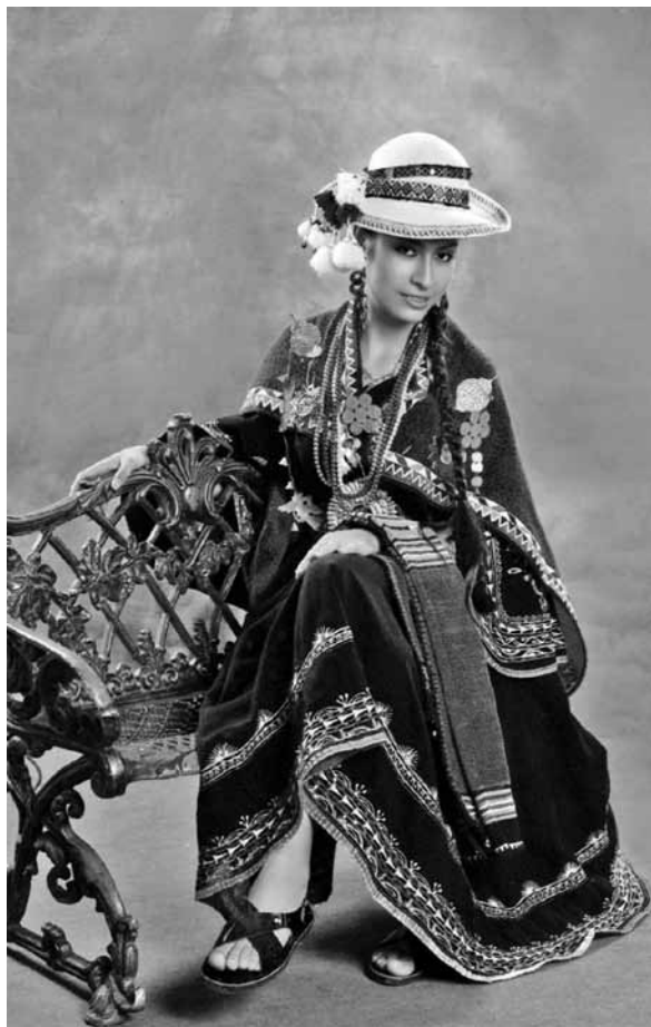
Cintia de 17 años con traje típico de San Lucas Nor Cinti Chuquisaca

agradecida y orgullosa. Desde mi tierna infancia he convivido con pautas culturales simbólicas y prácticas seguidas, obviamente, de la adquisición natural y espontánea de la lengua quechua en contextos de uso real. Esta situación vino seguida también de un amor entrañable a mi cultura.