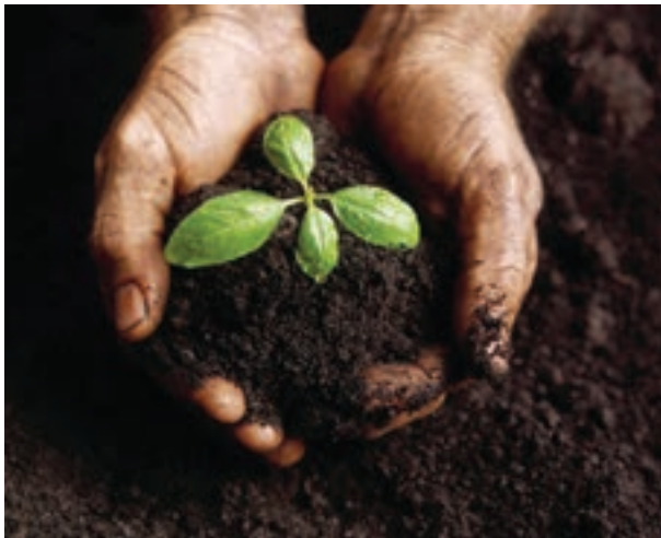
شکل ۴-۱- خاک محل رویش گیاه

کره خاکی یا سنگ کره تنها مکان مناسب برای سکونتگاه بشر بر روی سیاره زمین می باشد. خارجی ترین بخش زمین از خاک تشکیل شده است. خاک محصول فرسایش و خردشدگی سنگ هاست و محل رویش گیاهان می باشد (شکل ۴-۱). پس غذای انسان و تعداد زیادی از موجودات زنده وابسته به خاک است.