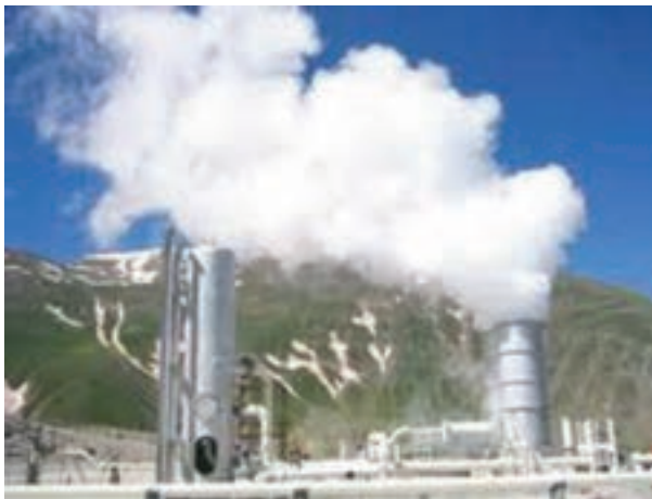
شکل ۱-۸- نیروگاه زمین گرمایی مشکین شهر - اردبیل

استفاده از مواد معدنی تنها محدود به همین موارد نمی‌گردد. اگر به اطرافمان خوب نگاه کنیم مثلاً مدادی که با آن می‌نویسیم، عینکی که به کمک آن می‌بینیم، وسایلی که با آن زندگی می‌کنیم، داروهای که برای التیام دردهایمان از آن استفاده می‌کنیم و حتی خمیردندانی که هر روز از آن استفاده می‌کنیم، همه و همه در گروه موادی است که از زمین استخراج می‌شود.