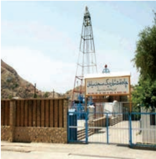
شکل ۹-۱-ب - موزه نفت در محل اولین چاه نفت خاورمیانه - مسجد سلیمان

این سادگی مقذور بود؟ خوشبختانه کشور ایران از جمله کشورهای معدنی جهان است که دارای معادن متعدد آهن، مس، سرب و روی، طلا و ... است. همچنین بیش از صدسال قبل تاکنون با کشف نفت در حوالی مسجدسلیمان اقتصاد کشورمان متوجه این نعمت خدادادی شده است (شکل ۹-۱-الف و ب). این قابلیت‌ها سبب گردیده تا ایران در بین کشورهای جهان، کشوری قدرتمند و تأثیرگذار باشد.