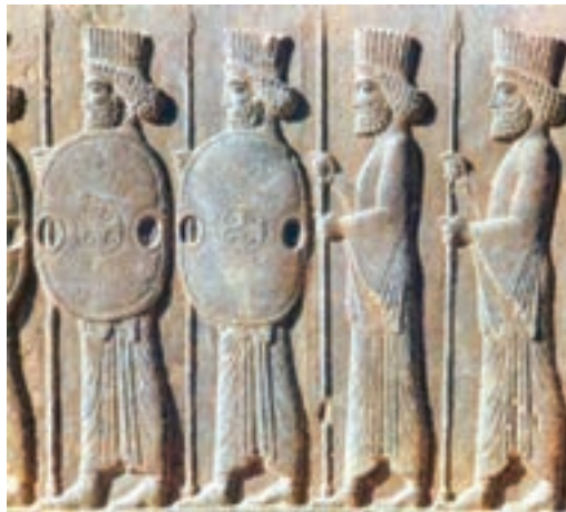
شکل ۱-۵- ادوات نظامی هخامنشیان

انواع ذخایر معدنی فلزی و غیرفلزی از دیگر ویژگی‌های بخش بیرونی پوسته زمین است که آگاهی نسبی از نحوه تشکیل آنها نیاز به کسب تخصص در رشته زمین‌شناسی دارد. توجه به ذخایر معدنی در ایران به هزاران سال قبل باز می‌گردد. به عنوان مثال ایرانیان در زمان هخامنشیان با دسترسی به ذخایر سنگ آهن، از آن در ساخت وسایل و ابزار جنگی بهره جسته و بدین طریق از سرزمین پهناور ایران در مقابل هجوم بیگانگان محافظت کردند (شکل ۱-۵).