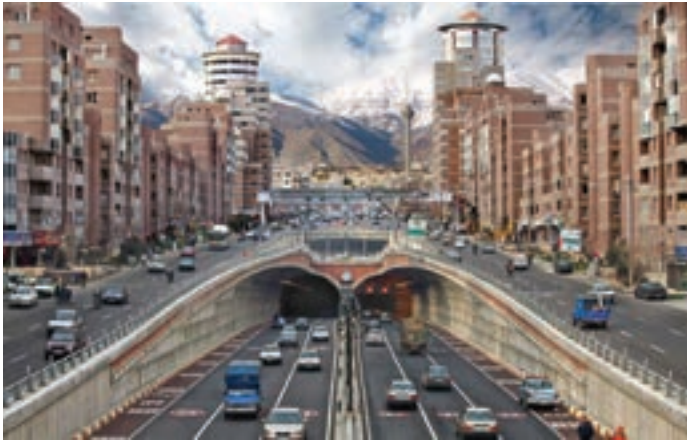
شکل ۱-۱۰- ورودی تونل توحید - تهران

رائش زمین، سقوط سنگ و غیره باید خصوصیات زمین را بطور جدی بررسی کرد. امروزه اهمیت این موضوع تا آن حد است که حضور کارشناس زمین‌شناس در شهرداری‌ها و محیط زیست قطعی و اجتناب‌ناپذیر می‌باشد (شکل ۱-۱۰).