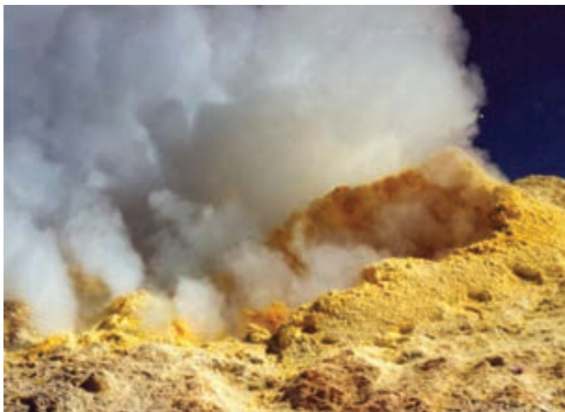
شکل ۱۲-۱- دهانه اصلی آتشفشان تفتان