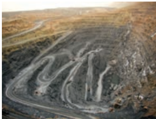
شکل ۱-۶- معدن سرب و روی ایرانکوه - اصفهان

در دهه‌های اخیر کشف ذخایر باارزش اورانیم سبب گردید تا با دستیابی به توان هسته‌ای، ایران نیز مانند سایر کشورهای پیشرفته جهان از آن در صنایع دارویی و تولید انرژی استفاده نماید.