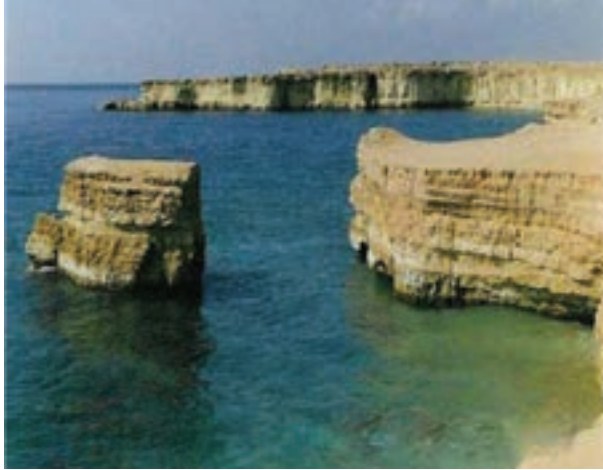
شکل ۳-۱- سواحل جنوبی ایران

کره خاکی یا سنگ کره تنها مکان مناسب برای سکونتگاه بشر بر روی سیاره زمین می باشد. خارجی ترین بخش زمین از خاک تشکیل شده است. خاک محصول فرسایش و خردشدگی سنگ هاست و محل رویش گیاهان می باشد (شکل ۴-۱). پس غذای انسان و تعداد زیادی از موجودات زنده وابسته به خاک است.