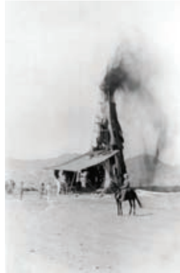
شکل ۹-۱-الف - فوران نفت از اولین چاه نفت خاورمیانه در سال ۱۹۰۸م - مسجد سلیمان