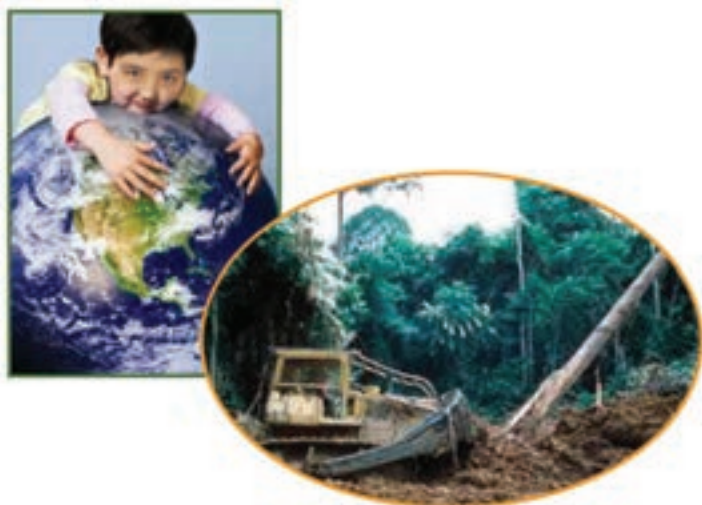
شکل ۱۱-۱- تخریب و حفاظت از محیط زیست

کره زمین دارد. در همین رابطه سازمان علمی - فرهنگی یونسکو، سال ۲۰۰۸ میلادی را سال سیاره زمین نامگذاری کرد، هدف از این اقدام، توجه انسان‌ها به کره زمین به عنوان تنها مکان برای زندگی است که استفاده نادرست از آن موجب نابودی زمین خواهد شد.