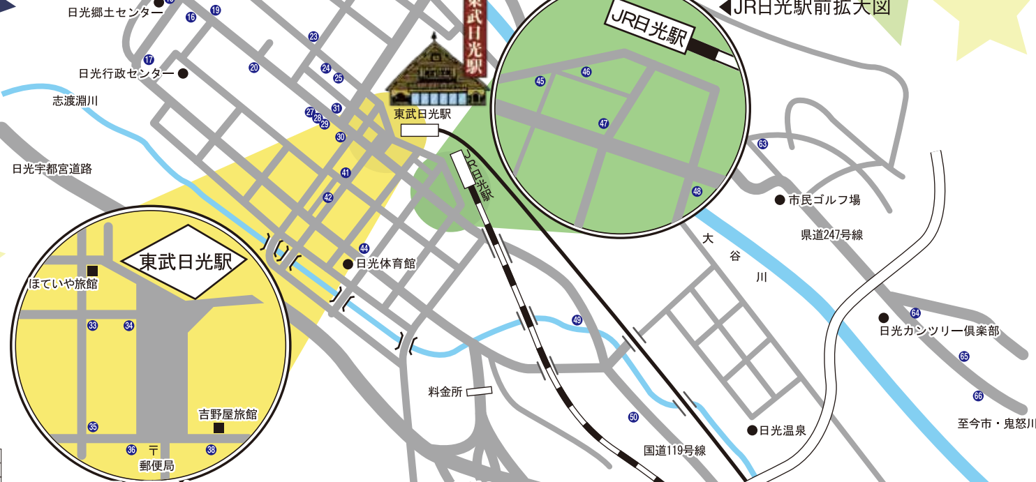
▲東武日光駅前拡大図