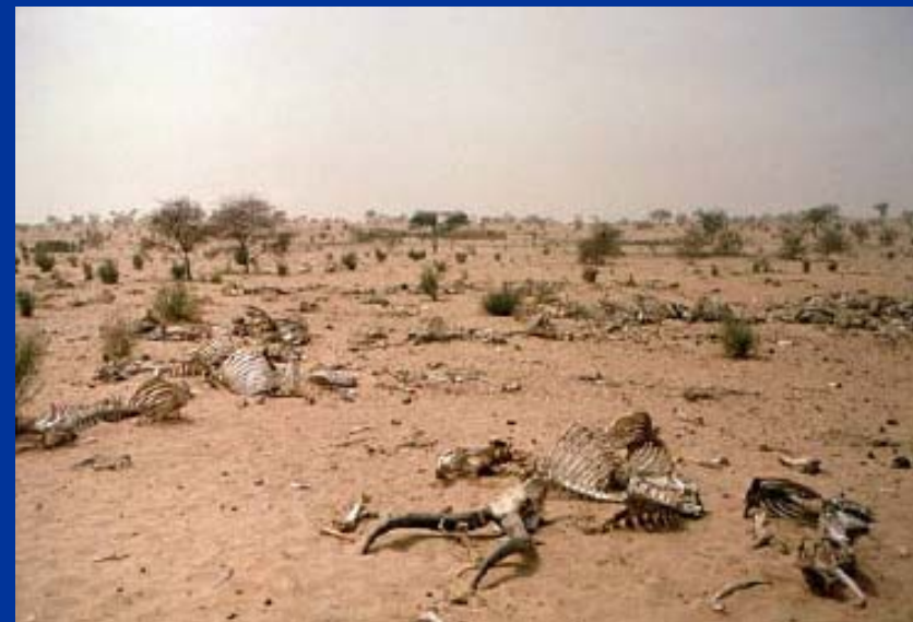
Muerte de ganado