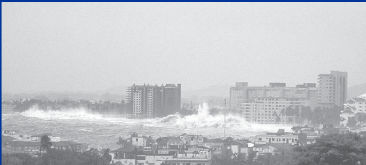
Oleaje por el huracán Kenna, Puerto Vallarta 2002