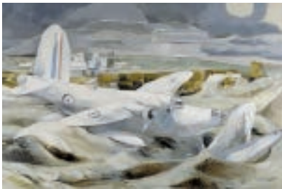
2 Paul Nash Defence of Albion / Verteidigung von Albion 1942, Öl auf Leinwand /oil on canvas, 122×183 cm, Imperial War Museum, London