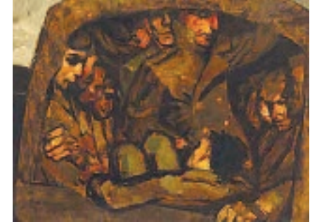
13 Dementij A. Šmarinov, Расстрел (Erschießung/Execution) aus dem Zyklus Kriegsjahre / from the cycle War Years , 1942, 36×49 cm