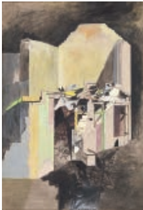
6 John Piper House of Commons, 1941 , Öl auf Leinwand / oil on canvas , 91×122 cm Parliamentary Art Collection London