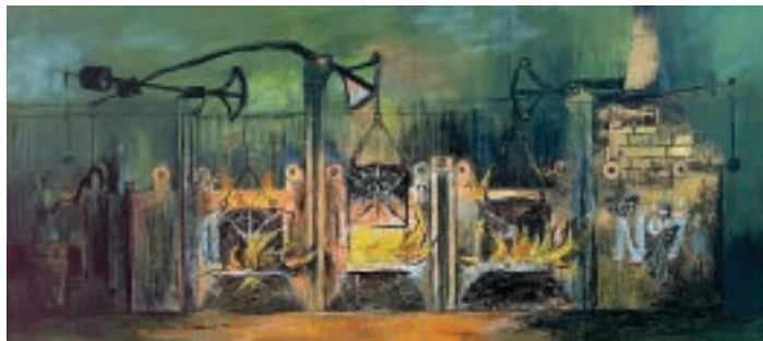
9 Graham Sutherland Furnaces / Hochöfen, 1944 , Öl, Gouache und Bleistift auf Papier auf Hartfaserplatte / oil paint, gouache and graphite on paper on hardboard , 69×152 cm, Tate, London