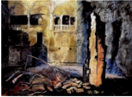
7 Graham Sutherland Devastation, 1941: An East End Street / Zerstörung, 1941: Eine Straße im East End 1941, Crayon, Gouache, Tusche, Grafit und Aquarell auf Papier auf Hartfaserplatte / crayon, gouache, ink, graphite and watercolour on paper on hardboard , 65×110 cm, Tate, London