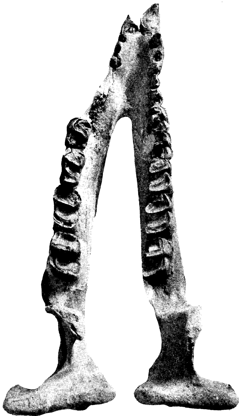
Urtinotherium incisivum gen. et sp. nov. V. 2769 下頷骨，冠面視， \times 1/4 。