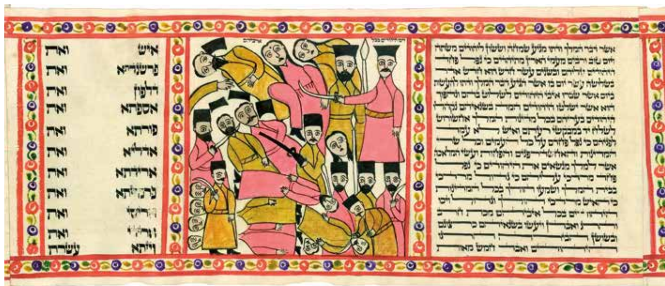
Megillat Esther, Indien um 1900