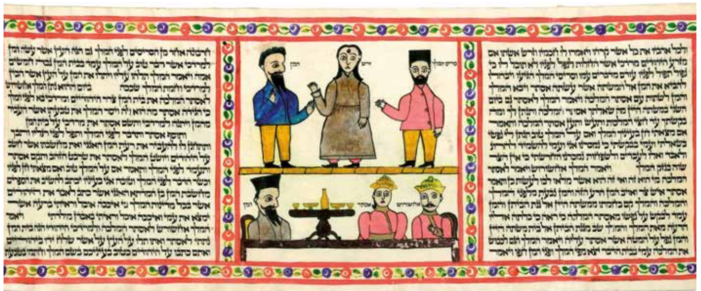
Megillat Esther, Indien um 1900

Размышления раввина Общины Ионы Северса к празднику Пурим 5780 года