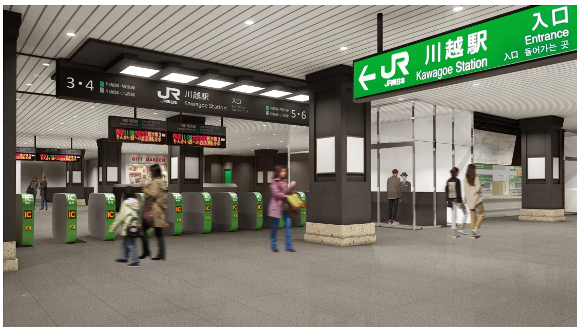
改良後の川越駅改札外観イメージ

自動改札機の位置を見直し、ラッシュ時の入場のお客さまと出場のお客さまの動線を改善します。また、改札内の見通しを良くし、観光駅にふさわしい開放的なレイアウトとします。