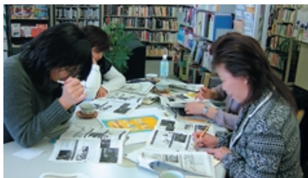
第5回作成委員会(韓国語・朝鮮語)の様子

この作成委員会は、災害時語学サポーター養成講座受講者、養成講座講師、県と高知市の国際交流員（CIR）に集まっていたが、主に情報提供媒体に載せるべき内容を決定することとグラ刷りの校正のため、昨年9月から今年2月にかけて計5回開催しました。委員会には述べ78人が参加し、以下のことを話し合いました。