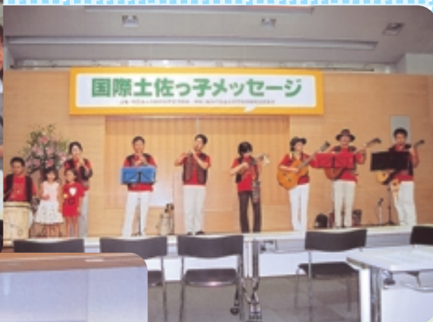
ロス・トマテスによる楽しい演奏