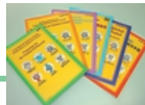
6カ国語パンフレット

昨年7月の災害時語学サポーター養成講座開催を皮切りに、19年度から本格的に動き出した在住外国人のための南海地震対策は、6カ国語（英語・中国語・韓国語(朝鮮語)・タガログ語・インドネシア語・ベトナム語）によるパンフレットとホームページ（HP）をこのほど完成させましたが、この2つの情報提供媒体に載せるべき具体的内容については、下で説明する「パンフレット等作成委員会」で検討・協議するなど、関係する方々から幅広く意見をいただきながら決めていきました。今回号では、2つの情報提供媒体の特徴や作成経過、20年度に予定する在住外国人のための南海地震対策についてご報告します。