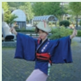
ポーズもばっちり！

イチョウの葉が全部落ちると、冬になる。「忘年会」や「新年会」が行われ、町もさらに賑やかになる。商店街に立てられたゴージャスなクリスマスツリーをみて、日本は洋風化しているね、と実感した。けれど伝統でも洋風でも、商店街の人気を集めればいいなあ、と私も何時の間にか、県民の立場にたつて思っていた。そうだ、今のわたしは、「お客さん」ではなく、いつも「高知県民」の一人として、高知のことを思っているのだ。なぜならば、高知の皆さんはこの外国人の私を暖かく受け入れたから。日常の翻訳や通訳のほか、中国の文化を紹介してほしいとの学校や市民団体の要望に応じて、よくそちらに派遣される。その時、小学生からお年寄りまで、さまざまな