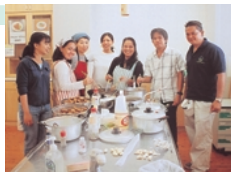
ワールドキッチン（フィリピン）

20年度も国際協力に対する理解を深めるイベントをJICA 四国や出展団体、ボランティアの方とともに作り上げていきたいと思えます。