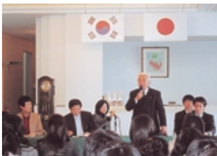
歓迎式(明德義塾高校研修会館)

韓国全羅南道光州市にある国際高校の生徒30名が、平成20年1月26日(土)から1月28日(月)にかけて明德義塾高校を訪問し、研修会館で日本人学生と寝食を共にしながらスポーツ交流や日本文化体験などをを行い、同世代の子どもたちとの交流を深めました。日韓両校の生徒の感想をご紹介します。