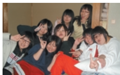
あふれる笑顔“ピース!”(左端が筆者)

スポーツ交流ではバスケットボールをしました。韓国の高校では、体育や美術、音楽のような大学入試に直接関係しない科目は週に1時間ぐらいで、それよりも重要な国語、英語、数学、科学、社会などの科目を自習することが普通です。そのため、体育が上手くてできる日本の学生たちがすごく羨ましかったです。また、日本語の授業で明德義塾高校の外国人留学生にも会ったり、初体験の生け花も先生に助けてもらって最後にはなかなかいい作品を作ることができて嬉しかったです。