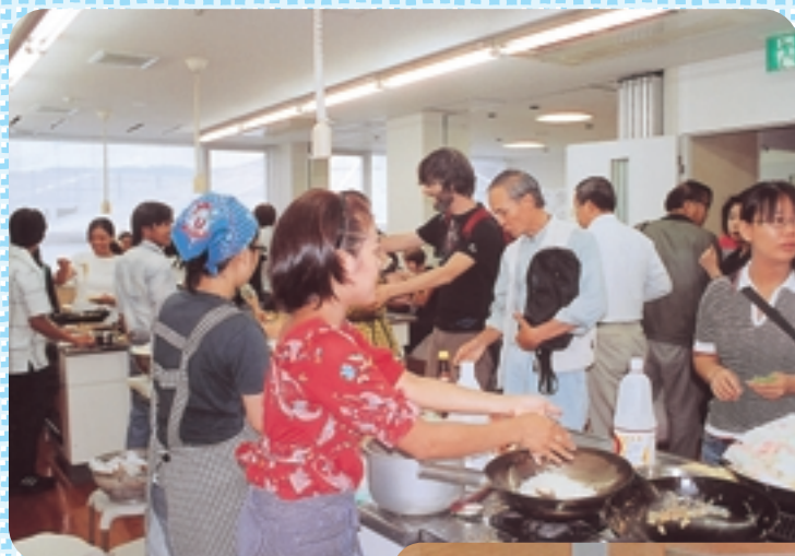
にぎやかなワールドキッチン