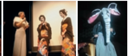
ちょびっとJAPAN映像祭