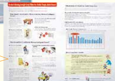
裏面は地震が起こった時の行動