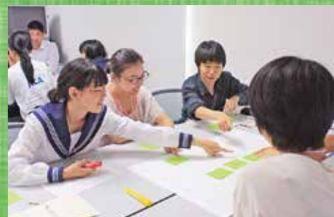
あなたが移住するとしたら何を持っていきますか？