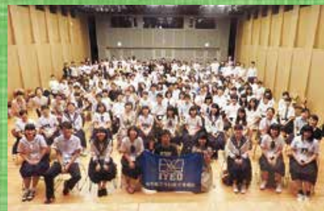
160名以上が参加したフォーラム(かるぼと小ホール)