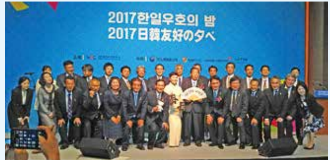
高知県訪問団の記念撮影(韓国・ソウル市)

翌12日には、訪問団はソウル市に向かい、各分野に分かれ、前全羅南道知事の李洛淵首相らとの面談や、本県からの輸出や国際観光の誘致に向けた取り組みなどを行いました。