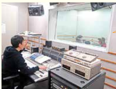
エフエム高知での収録風景

収録は、エフエム高知のスタジオを使用して、長く高知に住んでいる外国出身者や留学生に朗読していただきました。収録した内容は南海トラフ地震が発生した時に県内の民放ラジオ局から放送されます。