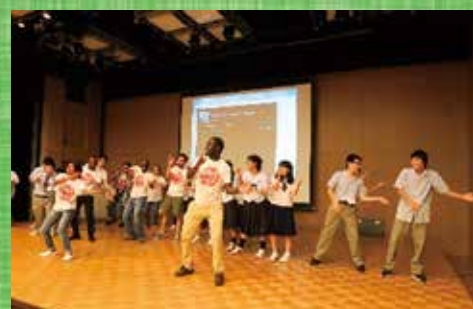
アイスブレイク・アフリカンダンス