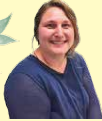
初級クラスⅡの皆さん

友達ができ、先生はきびしいけどやさしい。会話の練習になる。色々な国の人と一緒に勉強できるのが楽しい