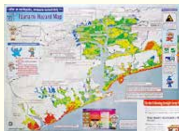
津波ハザードマップ英語版の表面

多言語版津波ハザードマップは、高知県国際交流協会配布しています。また、当協会ウェブサイトからもダウンロードできます。