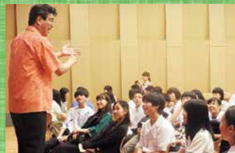
今日、みなさんがここにいる一番の理由は何ですか？