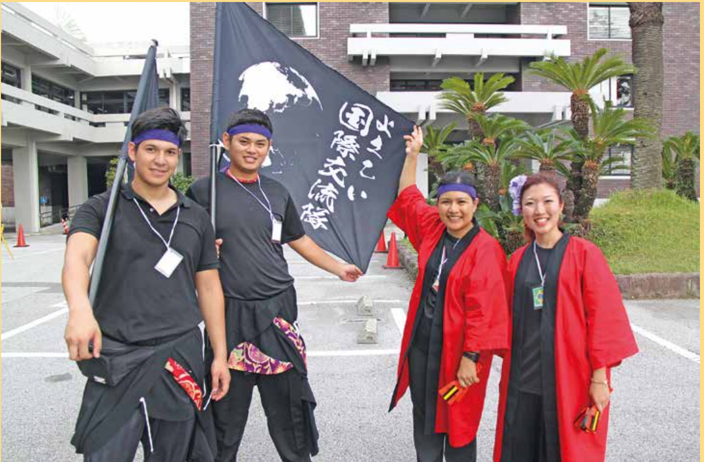
よさこい祭りに参加したフィリピンと南米からの研修員の皆さん（高知県議会議事堂前）