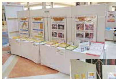
イオンモール高知でのパネル展示

パネル展示については、イオンモール高知や須崎市で開催された防災イベントなどで、パネル展示とパンフレット配布を実施し、外国人の防災についてPRを行いました。