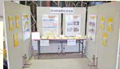
四万十市役所でのパネル展示

また、災害時でも円滑に情報を得られるよう当協会ラウンジに無料Wi-Fiを導入しました。