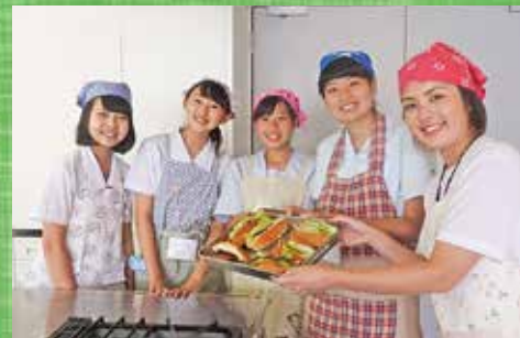
ベジタリアン調理教室へようこそ

2015年夏に高知市で開催された「日本青年国際交流機構第31回全国大会 高知大会」から始まった青少年GL育成フォーラムも、2016年夏には、「第1回高知県IYEO青少年グローバルリーダー育成フォーラム」へとリニューアルし、今夏で3回目の開催となった。今後は、フォーラムプログラムの50%を英語使用によるディスカッションプログラムへとレベルアップさせ、アジアを中心に海外参加青年を募集する等、さらに国際色豊かなフォーラムへと進化させていきたいと考えている。