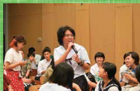
みなさん、私の意見を聞いてください！