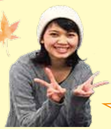
初級クラスⅢ ナイスさん