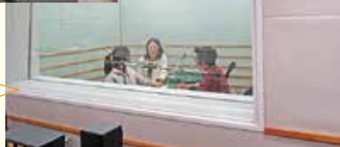
スタジオブース内の様子