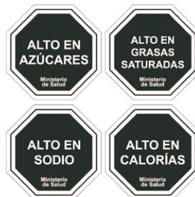
Diagrama N° 1

Las características gráficas de los descriptores nutricionales señalados en el Diagrama N°1 serán las siguientes: