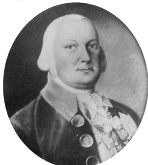
J.283.151 MARIE-ANTOINETTE, pstl, ov., a/r Vigée Le Brun (Mecklenburg-Strelitz PC). Lit.: Conisbee & al. 2009, p. 453 n.r.

Lauckhammer). Lit.: Cicerone , XII, .VI.1924, fig. 14 φ