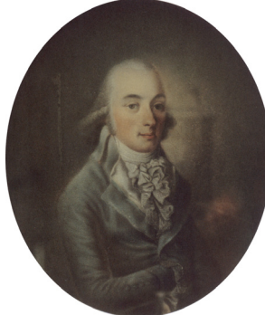
J.283.131 August Wilhelm IFFLAND (1759–1814), deutscher Schauspieler, Intendant und Dramatiker, pstl/pchm, 36x29.8, c.1790 (Saarbrücken, Stiftung Saarländischer Kulturbesitz, inv. 3000. Legs Dryander). Exh.: Dryander 2006, Tafel P6. Lit.: Güse 1995, no. 58 φ