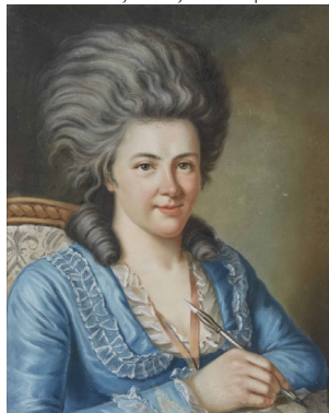
J.283.159 Reichsgräfin von OTTWEILER, née Katharina Kest (1757–1829), Gemahlin des Fürsten Ludwig zu Nassau-Saarbrücken 1788, pstl/pchm, 35.9x30.4, c.1790 (Saarbrücken, Stiftung Saarländischer Kulturbesitz, inv. 2425). Lit.: Güse 1995, no. 58; Dryander 2006, Abb. 11 φ