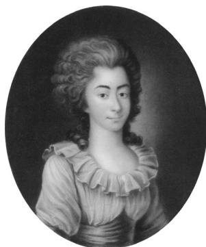
J.283.161 ~repl., pstl, 36.4x29.5 ov., s “J. F. Dryander Saarbrücken” (Eichenzell, Schloß Fasanerie, inv. 543, as of Wilhelmine Fürstin von Nassau-Saarbrücken, née Prinzessin von Schwarzburg-Rudolstadt (1751–1780)) [new identification] φν