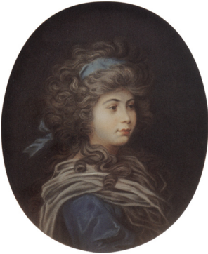
J.283.168 ~version, m/u (Assenheim, Kreis Friedberg, Schloß)