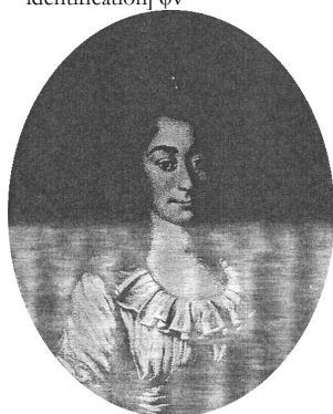
J.283.163 PHILIPPINE CHARLOTTE Sophie Gräfin zu Solms-Rödelheim und Assenheim, née von Solms-Laubach (1771–1807), pstl/pchm, 33x27, 1785 (Saarbrücken, Stiftung Saarländischer Kulturbesitz, inv. 3001. Legs Dryander). Exh.: Dryander 2006, p. 28, Abb. 8 φ