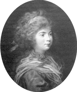
~version, miniature/ivory (London, Christie's, 21.VI.1999, Lot 188 part, as of Therese Mathilde von Mecklenburg Strelitz, Fürstin von Thurn und Taxis (1773–1839) by Anton Oechs)