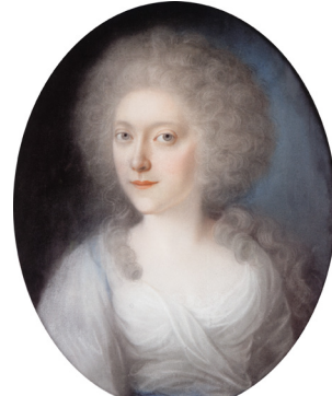
J.283.188 Junge Frau, pstl, ov. (desc. Saarbrücken PC 1928). Lit.: Lohmeyer 1928, p. 224 repr. fig. 2 Φ