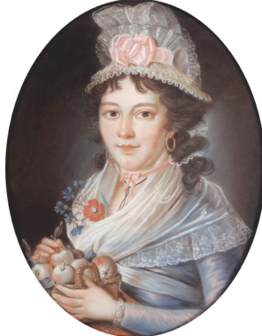
J.283.186 Junge Frau, pstl/pchm, 37.3x29.7 ov. (Saarbrücken, Stiftung Saarländischer Kulturbesitz, inv. 3374). Exh.: Dryander 2006, Tafel P9. Lit.: Lohmeyer 1928, p. 224 repr. φ