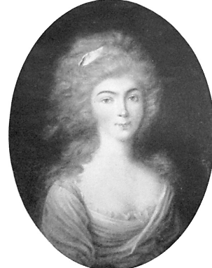
J.283.192 Junge Frau, pstl, 40.5x33.5 (Marseille, Étude de Provence, 7.III.2021, Lot 507 repr., éc. fr., est. €400–500) [new attr., ?] φα