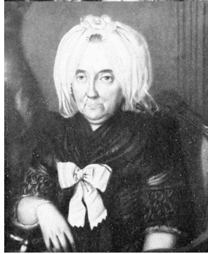
J.283.18 Unbekannter Adliger, pstl/pchm, 43.6x34.5, sd "Dryander pinxit/1778" (Saarlandmuseum, inv. NI 1776. Fürst Ludwig von Nassau-Saarbrücken. Propyläen-Kunsthandel, Berlin, 1957). Exh.: Dryander 2006, Tafel P1. Lit.: Best 2000, fig. 2 φ