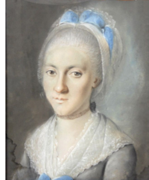
J.283.137 Vieille dame de la famille LE CAVELIER, pstl, 37.5x29, c.1780–90 (desc. Familie, Simon Kirn und Sulzbach; Saarbrücken, Dawo, 10.IX.2014, Lot 189 repr., anon., est. €100) [new attr., ?] φαv