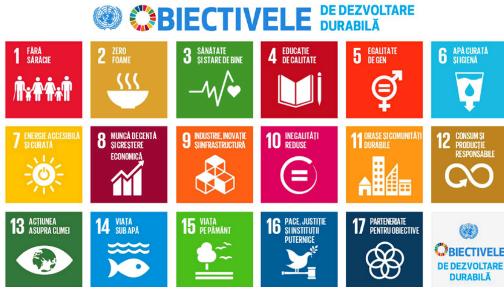
Fig.5 Reprezentarea Obiectivelor de Dezvoltare Durabilă