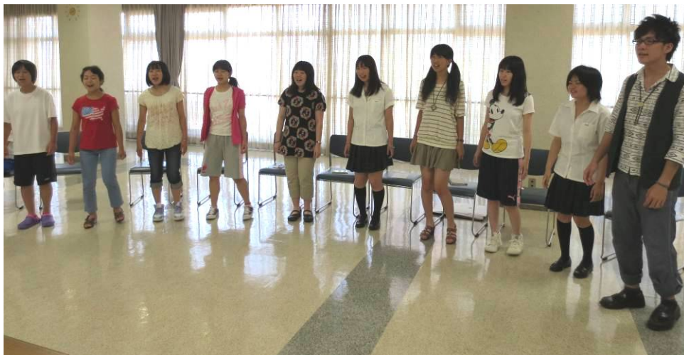
研修も終盤になると、歌詞は完璧！笑顔も出て、明るく楽しく歌えるようになりました。