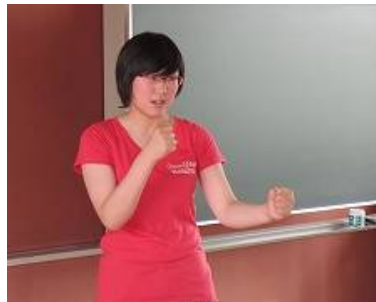
優果ちゃんが構えると、さすが！ と一っつもカッコいいです！！