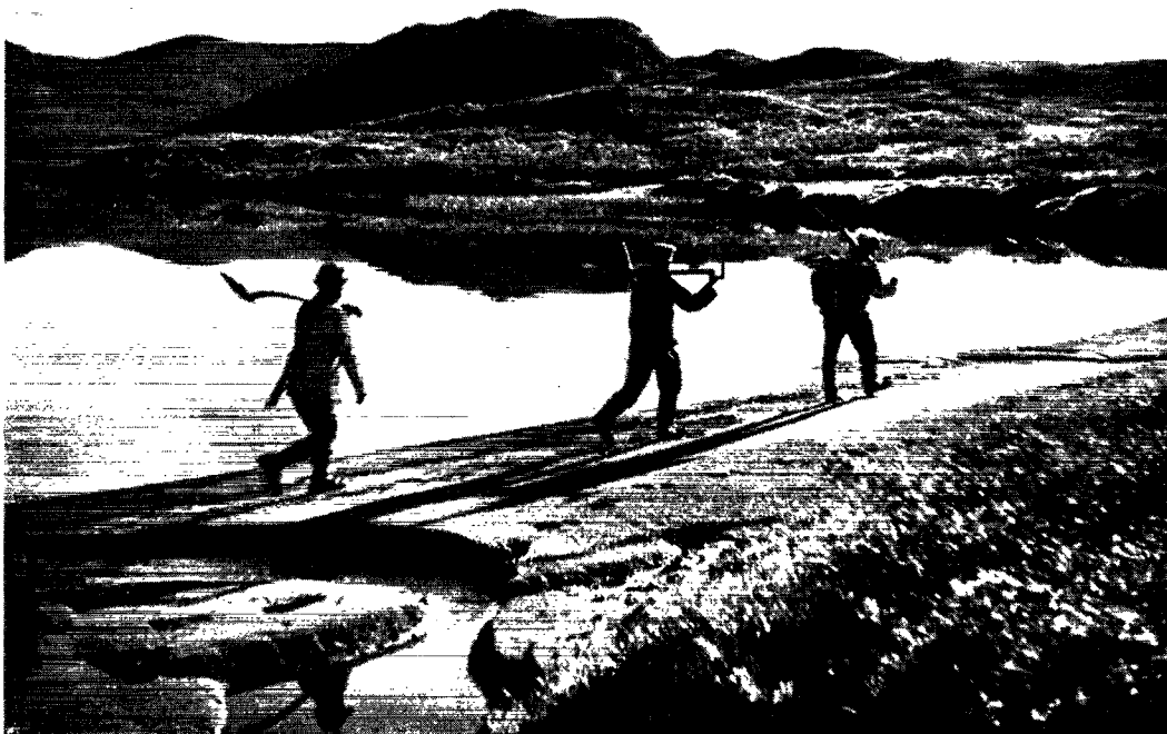
Arkæologer på vandring mod en nordbogård i indlandet, Valnahverfi i Østerbygden.