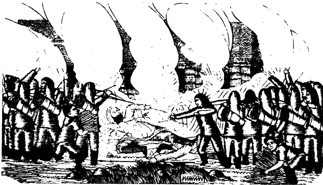
Aron's bekendte træsnit illustrerende eskimoernes afbrænding af en nordbogård.

tet. Modsætningen var at finde på afsidesliggende fjældgårde, hvor de lange vinteraftener nok kunne virke knugende i ensomheden for den lille familiegruppe ved spæklamperne, maaske samlet om et brætspil, men tavse, dagen og ansigterne havde været som i går.