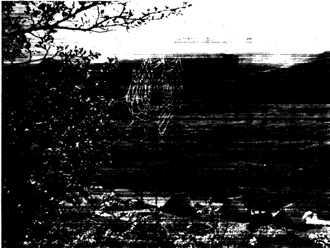
Teltlejr ved udgravningen af en nordbogård i Vatnahverfi i Østerbygden.