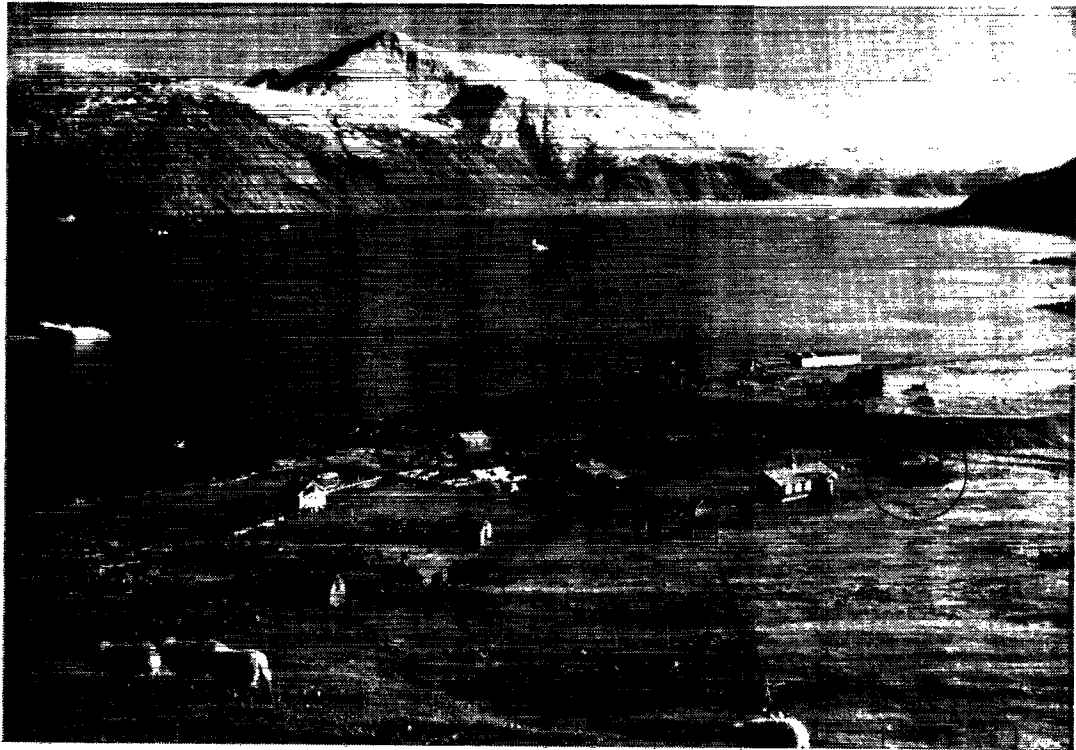
Qagssiarssuk bygden. Cirklen til venstre: ruinerne af »Erik Rødes Hal«. Cirklen til højre: Tjodbildes Kirke.