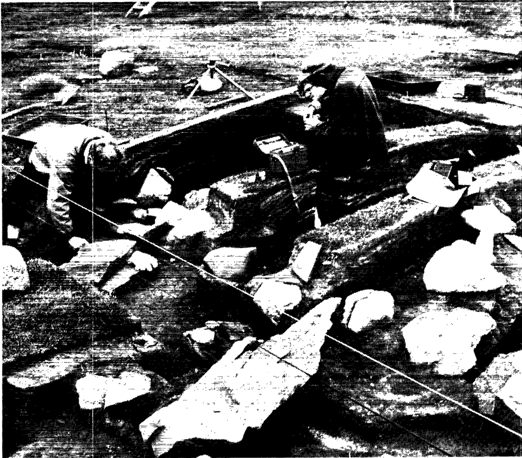
Udgravning af Tjodhildes kirke. 1962.

Sagaskriveren slutter beroligende: »Torstein og de andre lig blev førte til kirken i Eriksfjord på Brattalid, og der blev sunget over dem af præsterne«. – Det var i året 1002...«