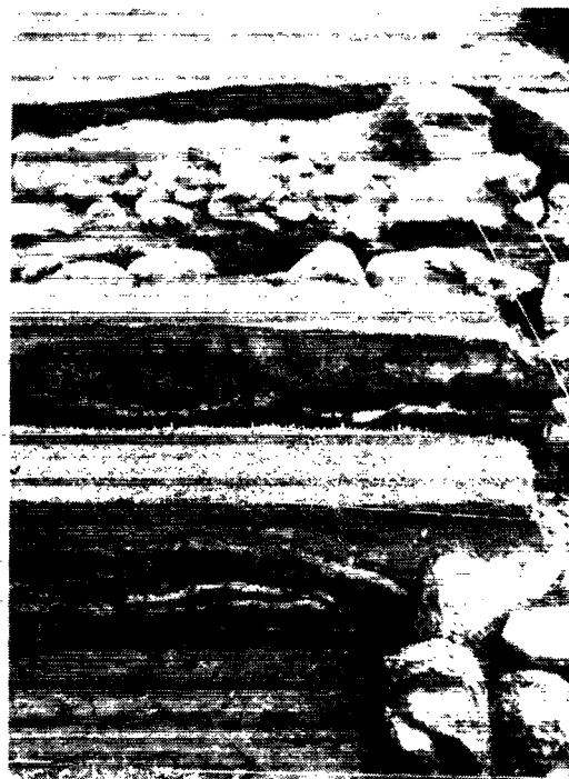
Tværsnit gennem torvemuren i Tjodhildes Kirke. Fot.: Jørgen Meldgaard 1961. Snittet viser de sammen- pressede lag af græstørv i en af langmurene.

Kateket Motzfeldt tog imod mig på Brattalid den 13. september. Oppe på en