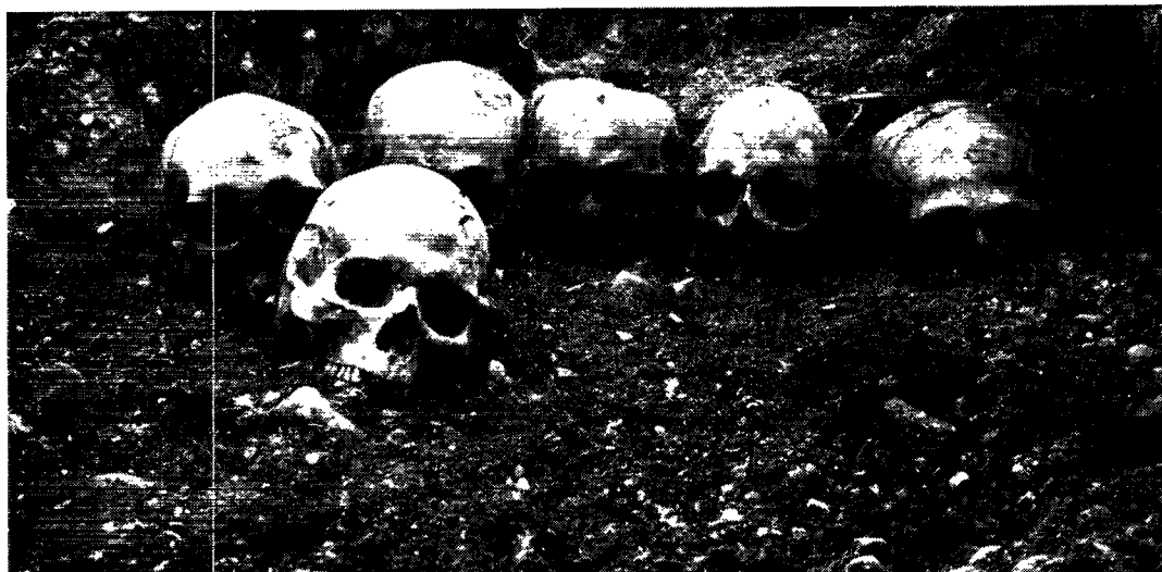
Kranier i fællesgraven syd for kirken.

Om kristendommens indførelse og den første kirke beretter sagaerne. Leif Eriksøn vender i år 1000 hjem fra et besøg i Norge, hvor han ved kong Olaf Tryggvasøns hof i Trondheim har ladet sig døbe og overtale til at forkynde kristendommen i Grønland. Han får en præst og andre gejstlige med sig. Ifølge Erik den Rødes saga (Hauksbók) er rej-