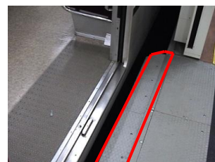
可動ステップ：赤枠部分がホームドアの開閉に連動してスライドし隙間を埋める。

さらに、曲線ホーム区間でホームと車両の隙間が大きい箇所がある駅には、当該箇所に可動ステップも取り付け、より一層の安全性向上に努めています。