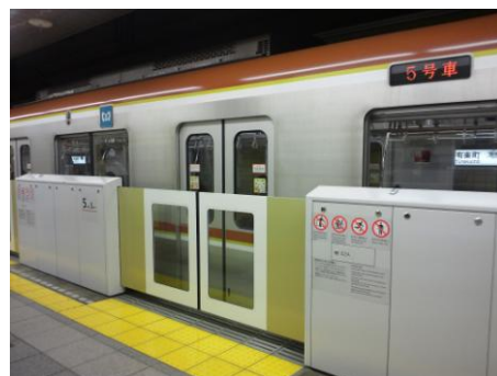
本年 3 月 10 日から使用開始された有楽町駅のホームドア

東京メトロでは、引き続き、平成 25 年度の完成を目指して有楽町線全駅にホームドアの設置を進めてまいります。工事期間中は、お客様に大変ご不便とご迷惑をお掛けしますが、ご理解くださいますようお願いいたします。