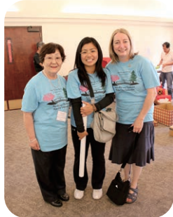
平成26 (2014)年 「日本/土浦まつり」でパジャリ！