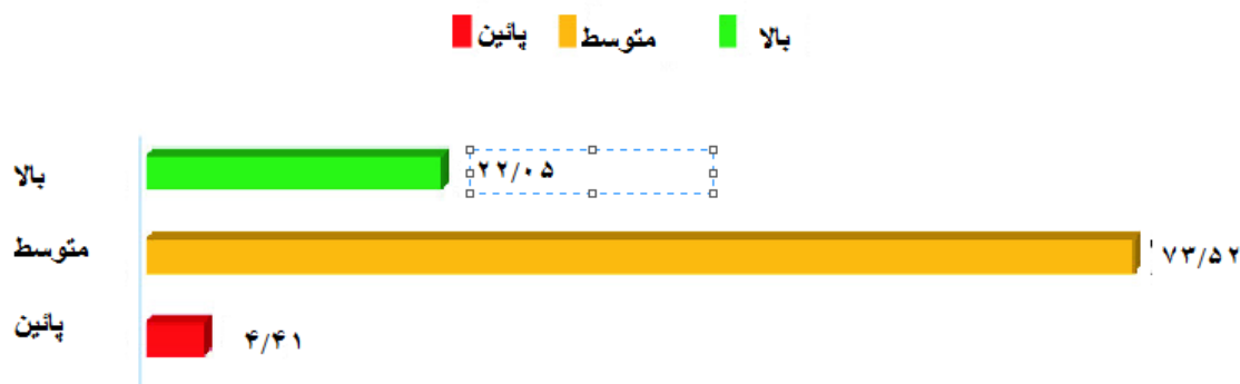
شکل ۱،۱ توزیع خانواده‌های طرفدار صیغه محرمیت با توجه به میزان وفاداری مذهبی یا پیشینه آنها

بر اساس احادیث شیعه (ثبت کلمات، اعمال و تأیید ضمنی رفتار پیامبر اسلام، حضرت محمد در اسلام) و روایات، «مُتَعَه» سنتی است که به منظور جلوگیری از فساد باید در جامعه رواج یابد (احمدی ۲۰۱۹). مُتَعَه نیازهای مردانی را برطرف می‌کند که به دلیل وضعیت اقتصادی ضعیف، قادر به ازدواج دائمی نیستند. بر اساس فقه شیعه، ازدواج موقت و صیغه محرمیت از نظر شرعی جایز است. اکثریت منابع دینی و علمای مذهبی در جمهوری اسلامی ایران نیز به اتفاق آراء، صیغه محرمیت و ازدواج موقت بلافاصله پس از ظهور بلوغ را باور داشته و آن را به افراد توصیه می‌کنند (احمدی ۲۰۱۹). با این حال، برخی از فقها، مانند آیت الله سنایی، استدلال می‌کنند که مُتَعَه فقط در زمان جنگ و در اوایل اسلام قابلیت اجرا داشته است و در جامعه مدرن امروز، می‌تواند منجر به تخریب نظام خانواده گردد. در پایان، افراد با توجه به نیازهای اقتصادی، جنسی و عاطفی خود، ازدواج موقت می‌کنند، بدون این که هیچ گونه گناهی متوجه آنها باشد. پس مردان این نوع ازدواج را مشروع می‌دانند، زیرا دین آن را جایز می‌شمارد.