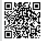
定額減税 特設サイト