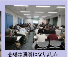
会場は満員になりました