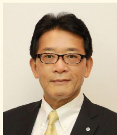
豊中市長 長内 繁樹