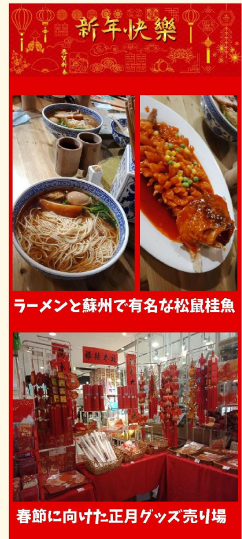
ラーメンと蘇州で有名な松鼠桂魚

中国は、ものすごく広い国。中華料理と一言言っても、地方によって味付けも料理もさまざまです。中華料理は辛いイメージがありますが、私の住んでいる蘇州の料理は、甘めの味付けのものが多いんですよ。蘇州で有名な料理といえば、まず、「松鼠桂魚」。桂魚という魚に切り込みを入れて揚げ、甘酢の餡をかけた料理です。松鼠=リスを意味する言葉で、形がリスに似ていることから付いた名前だそうです。そして、もう一つ私が好きなのは、「蘇州麵」。細麺に、塩味や薄い醤油味のスープのあっさりとしたラーメンです。この蘇州麵は、安いものだと一杯150円ほどで食べられるんです！麵もたっぷり入っていて、安くて美味しくお腹いっぱいになります。中華料理の中でも、蘇州の料理は日本でもあまり知られていませんが、とってもおすすめです。