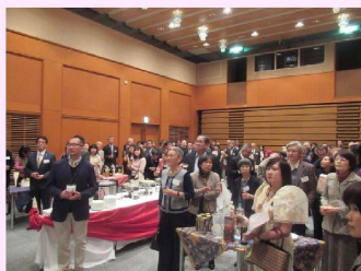
140名を超える参加者で 会場は大賑わいでした!

1月27日(日)、すてっぷホール(エトレ豊中5階)において当協会主催の「新春のつどい」を開催しました。フィリピン、インドネシア、タイ、ロシアの在阪外国公館、国会、大阪府議会、豊中市議会、豊中市他関係団体から140名を超える方々にご来場いただきました。