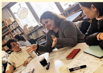
ボランティア研修の様子。 授業のアイデアをシェアしました

豊中市では、2006年度より市内全41校の小学校の3~6年生を対象に「外国語体験活動」を実施しており、当協会はその受託団体となっています。このプログラムでは英語に限らず、様々な国の言葉や文化を学ぶことが出来、希望の国や言語はそれぞれの学校によるリクエストに応じて事前に打ち合わせを行い決定します。