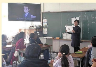
授業の様子。 子どもたちは真剣に話を聞いています