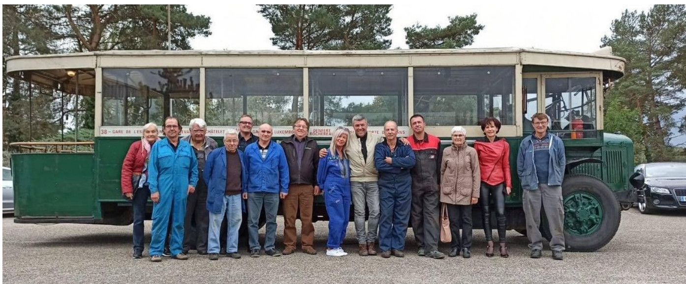
Une partie de l'équipe « d'acteurs », au retour d'une promenade / essai avec le Renault TN 4, le dernier jour, après la fin des séquences d'enregistrement