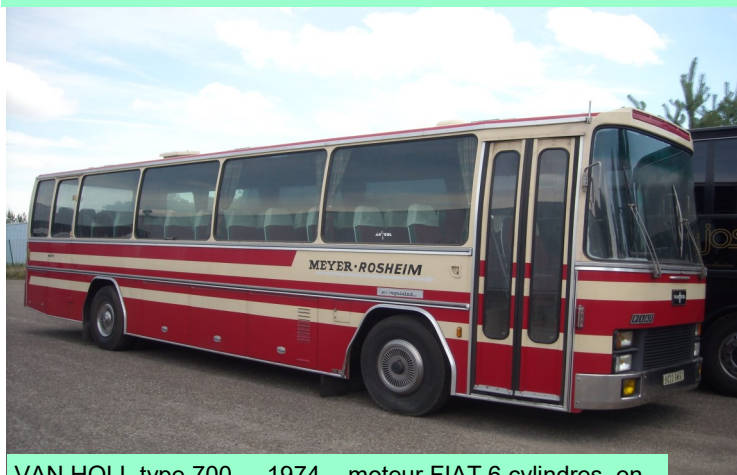
VAN HOLL type 700 - 1974 - moteur FIAT 6 cylindres, en position arrière, le véhicule a effectué toute sa carrière aux Autocars Meyer de Rosheim (Bas Rhin), il est dans un état de conservation exceptionnel