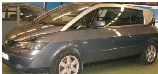
RENAULT Avantime, moteur Renault V 6, ce monospace coupé, produit par Matra pour le compte de Renault, n'a été produit que de 2001 à 2003, à seulement 8000 exemplaires environ