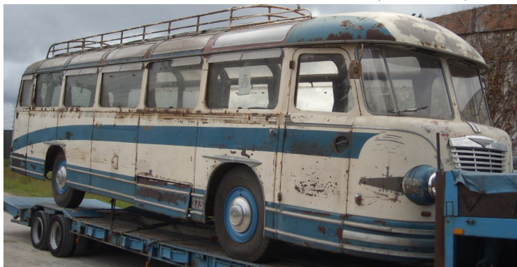
CHAUSSON type AH 50 1947 carrosserie Di Rosa (La Garenne Colomnes) modèle Atlantic, moteur Hotchkiss essence, 6 cylindres 105 Ch. Véhicule fabriqué à seulement une demi-douzaine d'exemplaires dont celui-ci est le dernier survivant