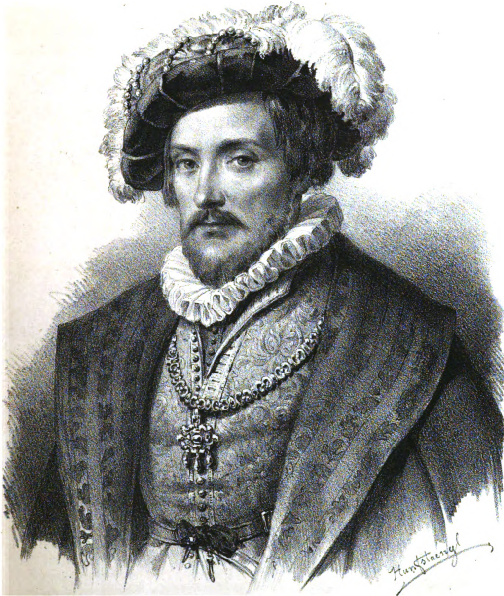
PFALZGRAF ALEXANDER, dritter Herzog von Pfalz-Zweibrücken?