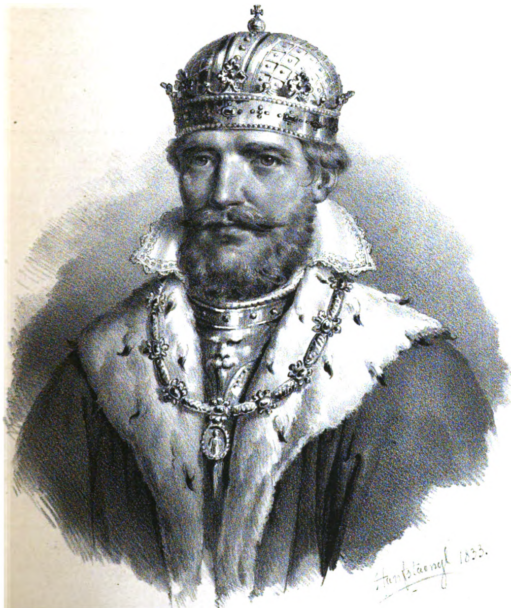
KAISER RUPRECHT VON DER PFALZ, Stammvater der Herzoge von Pfalz-Neuburg, geb. 1352, gest. 1410.