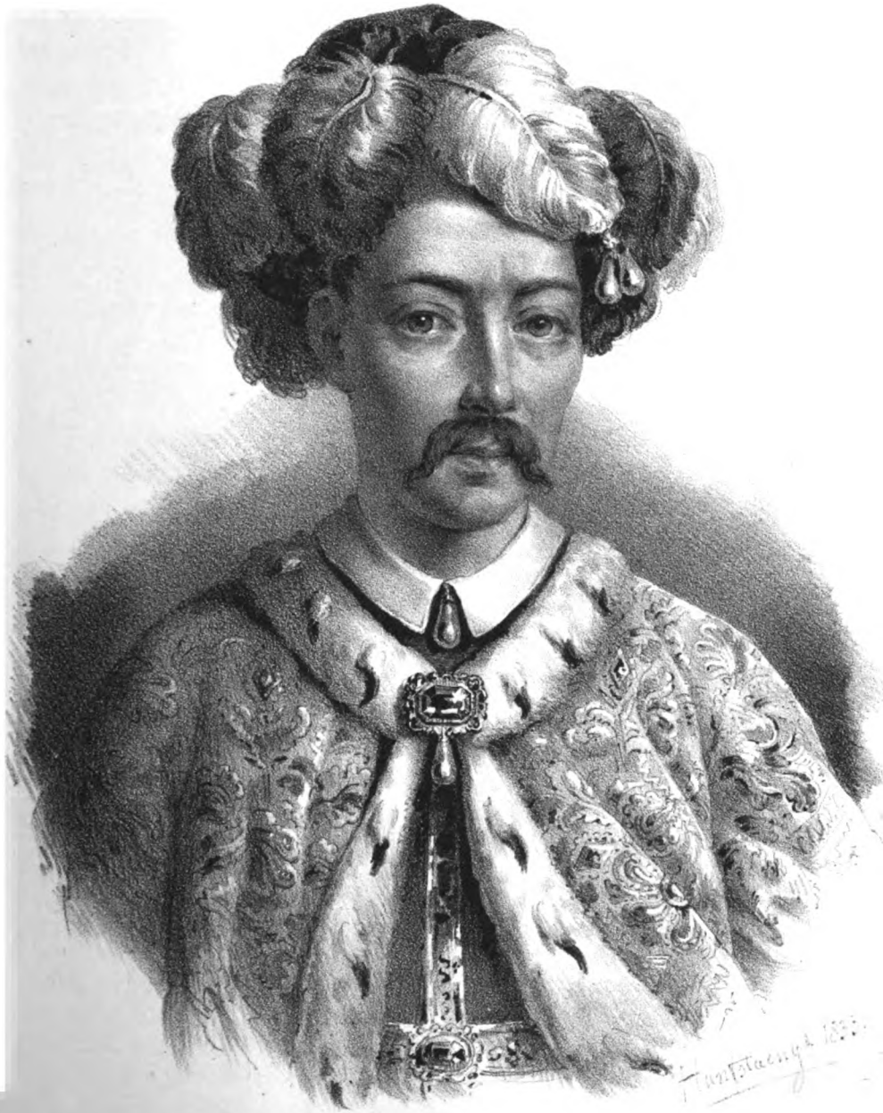
PFALZGRAF LUDWIG I, (genannt der Schwarze) zweiter Herzog von Pfalz-Knechtbrücken, geb. 1421, gest. 1489.