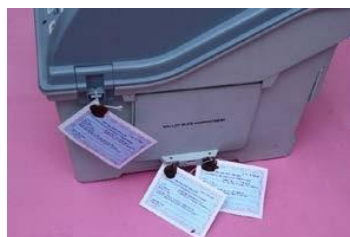
Sealing of Drop Box of VVPAT with Address Tag