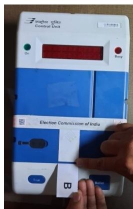
Affixing Green Paper Seal