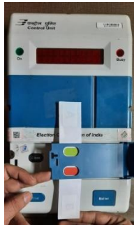
Fixing Green Paper Seal