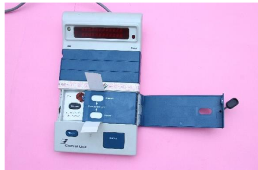
Sealing inner Result Section with Special Tag