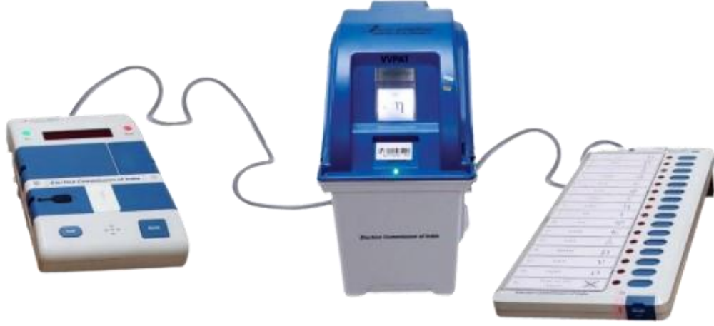
கட்டுப்பாட்டு அலகு வாக்காளர் தாம் அளித்த வாக்குப்பதிவுக் கருவி வாக்கினை சரிபார்க்கும் கருவி

மின்னணு வாக்குப்பதிவு இயந்திரம் (EVM): ஒரு மின்னணு வாக்குப்பதிவு இயந்திரம், கட்டுப்பாட்டுக் கருவி (CU) மற்றும் கம்பி வடத்துடன்(5மீ.நீளம்) கூடிய வாக்குப்பதிவுக் கருவி (BU) ஆகிய இரண்டு அலகுகளைக் கொண்டுள்ளது. ஒரு வாக்குப்பதிவு இயந்திரம் 16 வேட்பாளர்களைக் கொண்டிருக்கும். ஒரு கட்டுப்பாட்டுக் கருவியுடன் 384 வேட்பாளர்களைப் பதிவு செய்யும் வகையில் (நோட்டா உட்பட) 24 (இருபத்தி நான்கு) வாக்குப்பதிவுக் கருவிகளை இணைத்து பயன்படுத்த முடியும். பார்வைத்திறன் குறைபாடுள்ள வாக்காளர்களுக்கான வழிகாட்டுதலுக்காக, வேட்பாளர்களின் வாக்களிக்கும் பொத்தானுடன் வாக்குப்பதிவுக் கருவியின் வலது பக்கத்தில், 1 முதல் 16 வரையிலான இலக்கங்கள் பிரெய்லி முறையில் பொறிக்கப்பட்டுள்ளன. இது 7.5 மின்னழுத்த வோல்ட் திறன் கொண்ட மின்கலத்தில் (பேட்டரி) இயங்குகிறது.