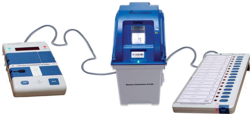
Control Unit (CU)