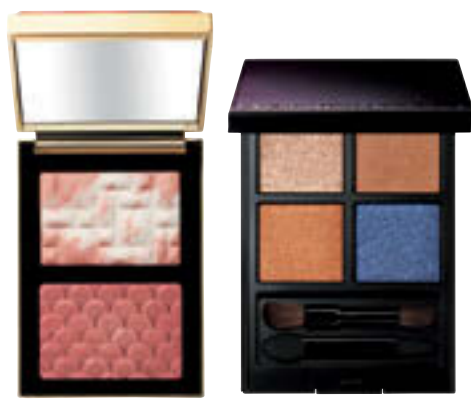
(左)ブラッシュ & ハイライト デュオピンクドーン グロウ デュオ ¥8,910 (24年1/2全国限定発売) / ポピイ ブラウン (右)アディクション ザ アイシャドウ パレット 108 ¥6,820 (24年1/5限定発売) / アディクション ビューティ

2024年の年明けから5月末まで、水瓶座は「試行錯誤」の時期となりそう。目元にネイビーやシルバーをまとい、澄んだまなざしで現実と向き合っていく。困難やプレッシャーもあるけれど、きつと乗り越えていけるから大丈夫。あなたにとって本当に大事なことが明確となり「やるしかない」と決心すると、未来への扉が開くことに。6月以降はホッと息つけそう。癒やしの色・パールピンクをまとい、趣味や友人との時間を過ごして、エネルギーの回復を。