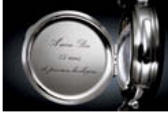
プラチナ・ケースのダストカバーには、現社長のティエリー・スターン氏から名誉会長のフィリップ・スターン氏へ贈られた一文が刻まれている