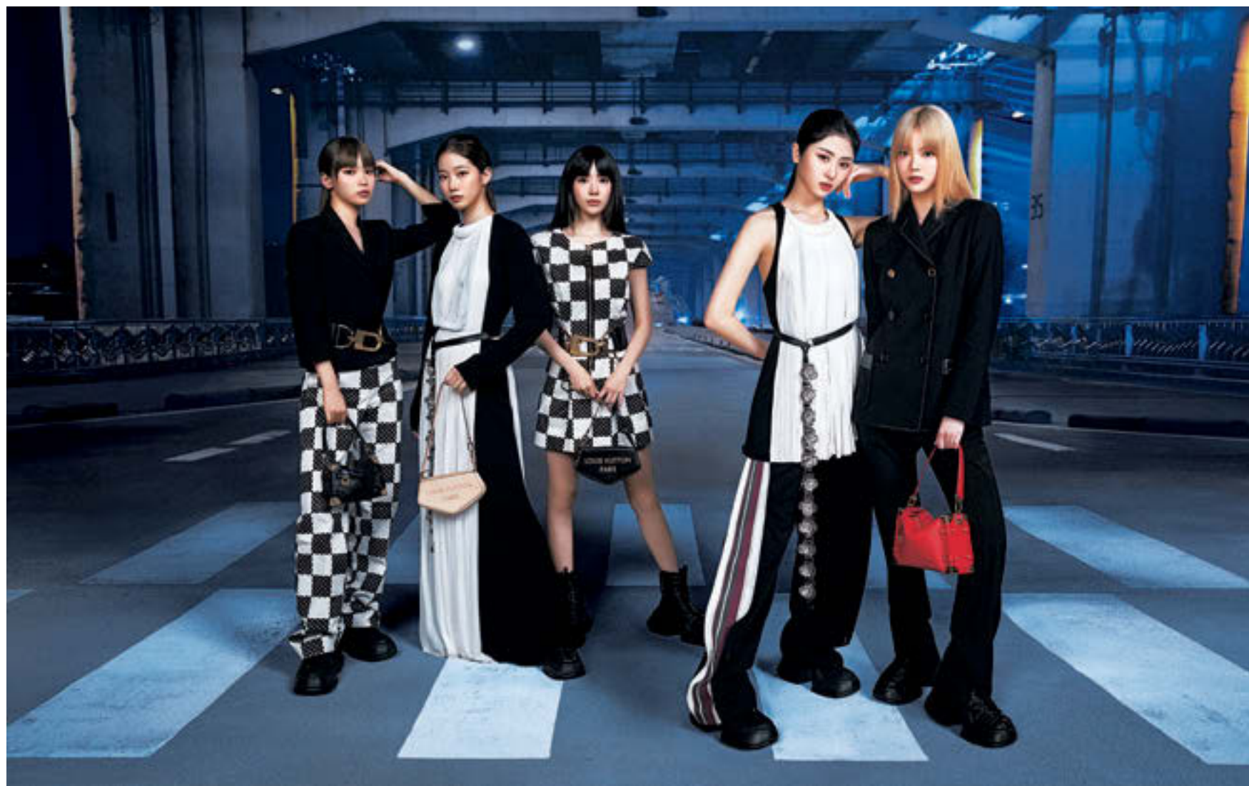
「ルイ・ヴィトン」の最新カプセル・コレクションのキャンペーンに登場したLE SSERAFIM。コレクションには、トランクのモチーフから着想を得てニコラ・ジェスキエールが 2015 年にデザインしたバッグ「GO-14」の特別なカラーも登場。またエンボス加工されたレタリングが印象的な「ボシエットクッサン」、韓国で幸運を象徴する伝統的な巾着「Bok-ju-meo-ni(ボクジュモニ)」にインスパイアされた「ノエ・ハース」なども揃う。(左から)ジャケット¥561,000 パンツ¥251,900 バッグ シューズ【ともに参考商品】/バッグ ¥316,800【参考価格】 ドレス ベルト シューズ【3点とも参考商品】/ドレス¥561,000 バッグ¥316,800【参考価格】 ベルト シューズ【ともに参考商品】/トランプス ベルト パンツ【すべて参考商品】/ジャケット¥621,500 バッグ¥599,500 パンツ シューズ【ともに参考商品】(すべてルイ・ヴィトン/ルイ・ヴィトンクライアントサービス)

今後さらなる活躍が期待されるなか、ルイ・ヴィトンが新たなアンバサダーに指名。“次世代のアイコン”との呼び声高い彼女たちの魅力に迫る。