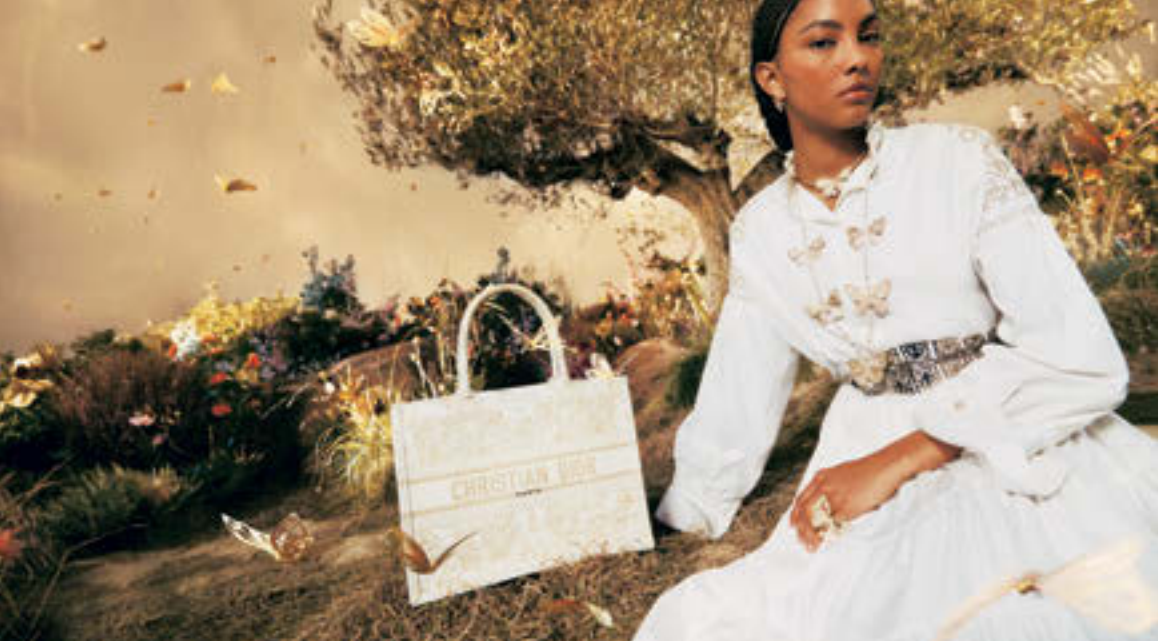
ホリデーシーズンのビジュアルは、メキシコの伝統やアーティストにインスパイアされた2024年のクルーズコレクションと呼ぶモードも表現されて

ホリデーシーズンのテーブルを華やかに彩るアイテムが「ディオール メゾン」から登場。ジャン＝ミシェル・オトニエルが手がける「ベルル」コレクション。自身の作品、「ザ ゴールド ローズ」を想起させるデザインは植物が持つ詩的な美しさを現代アートの視点で解釈している。プレート〈上から〉[16cm] ¥18,500 [29.5cm] ¥42,500 (ともにディオール メゾン/クリスチャン ディオール)