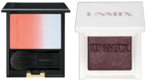
(左)ビュー カラー ブラッシュ 146 ¥6,050 (24年1/26限定発売) / SUQUU (右)アイリッドニュアンス 12 ¥2,860 (24年2/15発売) / UNMIX

自身の生活や立場を確立するために、山羊座は過去数年の間、奮起してきたのでは……? お疲れさまでした。2024年はようやく一段落して肩の荷が下ろせそう。山羊座に元気をチャージするスカイブルーやブラウンを身につけて、5月までは解放感を楽しんで。6月以降は癒やしの色・パールピンクをお守りに、溜まった疲労の解消が吉。何もしない休日やデジタルデトックスで心身を整えながら「今後何をしたいか」と、未来のプランを練って。