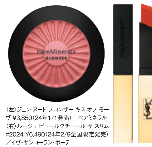
(左)ジェンヌード ブロンザー キス オブ モーヴ ¥3,850 (24年1/1発売) / ヘアミネラル (右)ルージュ ビュールクチュール ザ スリム #2024 ¥6,490 (24年2/9全国限定発売) / イヴ・サンローラン・ボーテ

2024年の獅子座のキーワードは、「大人の振り舞い」。5月26日までは目上の人や地位ある人との縁が増えるので、自己主張は控えめに。その場の主役になることが多い獅子座だけど、この時期はコラルのフェイスカラーで好印象を演出し、場の空気を読みながらニーズに応じていこう。ここで信頼を勝ち得ると、6月以降はやりやすい流れに。獅子座らしいオレンジをまとった唇で、ポジティブな発言をぜひ。仕事も遊びも充実するはず。