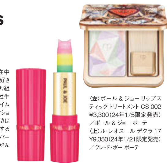
(左)ボール & ジョーリップスティックトリートメント CS 002 ¥3,300 (24年1/5限定発売) / ボール & ジョー ボーテ (上)ル・レオスール デクラ 17 ¥9,350 (24年1/21限定発売) / クレド・ポー ボーテ

現在、幸運と拡大の星・木星が滞在中の牡牛座は、2024年5月26日まで「好きなことや興味のあること」に全力で取り組むタイミング。いつもはマイペースな牡牛座だけど、この時期はフレッシュなライムグリーンを身につけて、積極的にアクションを起こしていこう。6月に入ると忙しきは一段落して、この1年の行動に対する「手応え」が返ってきそう。癒やしの色・パールをお守りに、自身を労りながら、がんばったことへの成果を享受したい。