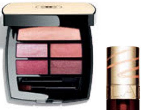
(上)レ ページュ パレット ルガール クールドゥ シャネル ¥8,800 (24年1/5発売) / シャネル (右)リップコンフォートオイル 18 ¥3,850 (24年2/5限定発売) / クラランス

共感性に優れ、心優しい魚座のあなたは、2023年から身近な人間関係に振り回されているのでは……? 2024年のテーマは、スバリ「人との距離感」。パールをまとった目元に心の奥深くを見つめ、「出来ること、出来ないこと」の線引きをして。1人で全てを抱え込まず、言葉にして伝えることも大切。発信力を助けるゴールドや、落ちついたモカ力を借りて、大切な人と前向きに話し合おう。無理のない形で、長続きする関係を築けるはず。