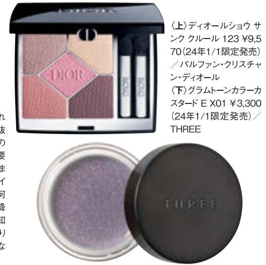
(上)デイオールショウ サンクルール 123 ¥9,570 (24年1/1限定発売) / パルファン・クリスチャン・ディオール (下)グラムトーンカラーカスタード E X01 ¥3,300 (24年1/1限定発売) / THREE

新たな人との縁や経験が次々と訪れた2023年を、牡羊座は一気に走り抜けてきたはず。2024年は過去1年の経験から、「自分にとって本当に必要なこと」へと集中していくターム。5月までは目元にランダーやグレーのアイシャドウをまとい、冷静な視点で今後何をすべきか「取捨選択」を。6月以降は「これだ!」と思ったことに対して、知識を深めていこう。シルバーをお守りに、スキル向上や勉強に励むと、次なる展開へと繋がっていく。