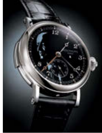
時計「ミニット・リピーター・アラーム1938P」[プラチナケース、ハンドステッチ・アリゲーター・バンド、ケース径41mm、自動巻] 価格は要問い合わせ [世界限定30本] (パテック フィリップ / パテック フィリップ ジャパン・インフォメーションセンター)