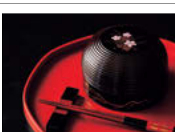
山中塗は、「塗りの輪島」「蒔絵の金沢」に並び、「木地の山中」と評される石川県の漆器の3大産地のひとつ

を大切に使い続けるために生まれた金継ぎ工房では天然漆による本格的な修復の見学も可能。地元文化に触れることのできる「界」の人気プラン「手業のひとつき」では、伝統の漆器生産者を訪れ、自分だけの酒器を手にする経験が待っている。ひとりでも、大切な誰かと一緒でも、滞在するだけで地域の文化と繋がることができる宿、それが「界」だ。あなたも、忘れられない加賀と出会ってみてはいかがだろうか。