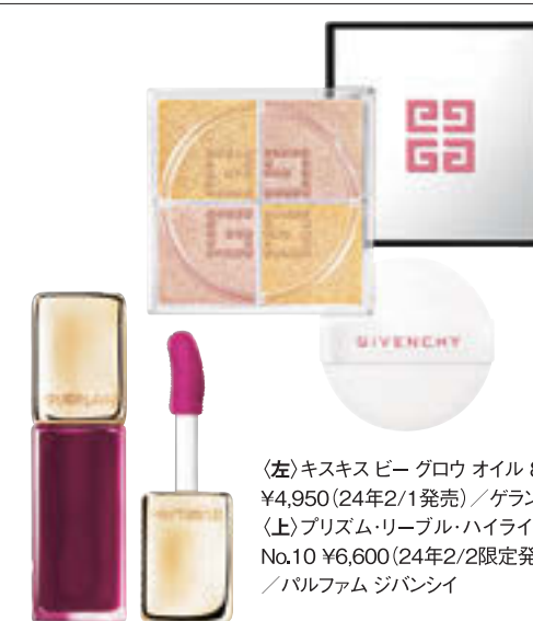
(左)キススピー グロウ オイル 809 ¥4,950 (24年2/1発売) / ゲラン (上)プリズム・リール・ハイライター No.10 ¥6,600 (24年2/2限定発売) / パルファム ジバンシイ

普段は控えめな乙女座だけど、2024年は「高みを目指す」が合言葉。「私なんて」という気持ちは封印して、いつもと違うアイテムや行動に挑戦してみよう。ゴールドの輝きを味方に「経験を自信に変えていこう」と、さらなる飛躍のステージへの扉が開くはず。年間通して公私ともに忙しいため、ときにキャパオーバーに陥ることも。6月以降はライラックをお守りに、心身のメンテナンスもお忘れなく。抱えきれないことは、周囲にサポートを求めよう。