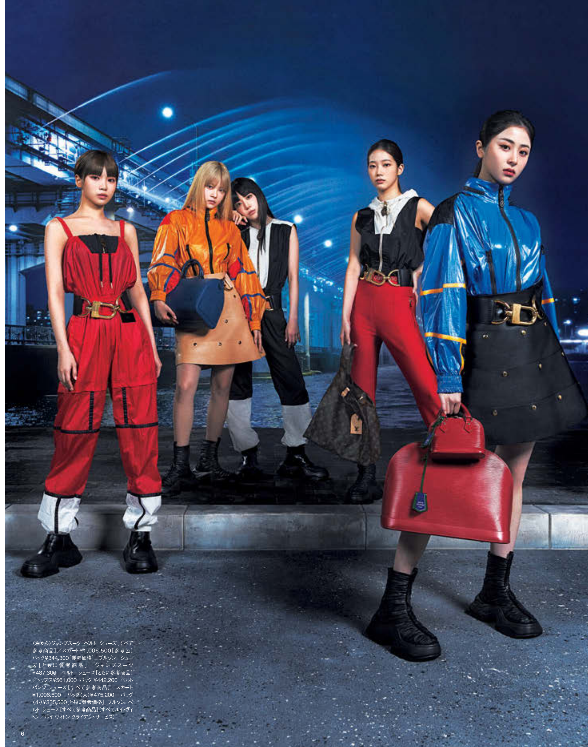
(左から)ジャンプスーツ ベルト シューズ【すべて参考商品】/スカート¥1,006,500【参考価格】 バッグ¥344,300【参考価格】 フルゾン シューズ【ともに参考商品】/ジャンプスーツ ¥487,300 ベルト シューズ【ともに参考商品】/トランプス¥561,000 バッグ ¥442,200 ベルト パンツ シューズ【すべて参考商品】/スカート ¥1,006,500 バッグ(大)¥475,200 バッグ(小)¥395,500【ともに参考価格】 フルゾン ベルト シューズ【すべて参考商品】(すべてルイ・ヴィトン/ルイ・ヴィトンクライアントサービス)

ヴィトンの世界観を大胆に表現している。それぞれの異なる個性を生かしつつ、1つのグループとしても見事な存在感を放つLE SSERAFIM。グループ名には「世界の視線に動揺せず、恐れずに前に進んでいく」という5人の決意も込められているというが、その言葉を体現するかのようにつねに新たな挑戦を続けている。エンドレスな魅力を持つ彼女たちは、これからも私たちに多くのブライズレスな瞬間を届けてくれるはずだ。