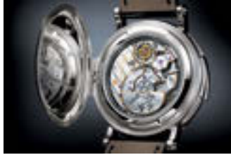
このモデルのために開発されたエクスクルーシブな新しいムーブメントを搭載。それによって新しい4件の技術特許も出願された