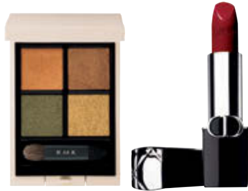
(左)RMK シンクロマティック アイシャドウパレット 06 ¥6,380 (24年1/12発売) / RMK Division (右)ルージュ デイオール 818 ¥5,940 (24年1/1発売) / パルファン・クリスチャン・ディオール

天秤座の2024年のテーマは、あなたが関わる個人や組織の「ニーズを先読みすること」。「口ではこういけど、本音はどうか」「最終的に何を望んでいるのか」、落ちついたグリーンやワインレッドを味方に熟慮を重ねよう。相手のニーズに先回りして応えようと、深い信頼関係を構築できるはず。5月26日以降は、前半に得た信用を元に戻すことができる流れに、ゴールドを味方に持ち前の社交術に磨きをかけて、新たなステージへ挑戦を。