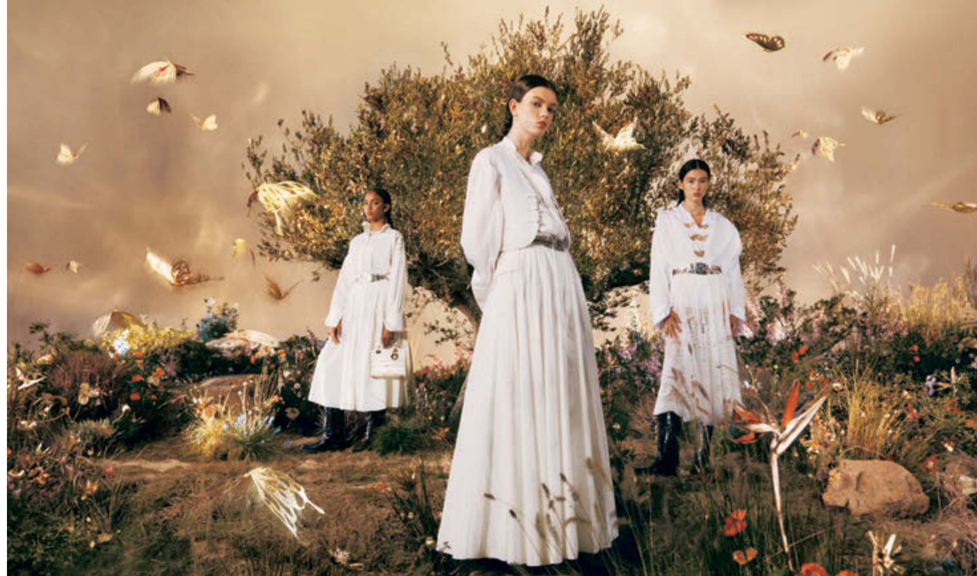
「TREE OF LIFE (生命の木)」を背景にゴールドの蝶が舞う、幻想的なホリデーシーズンのイメージビジュアル

フランス語で薔薇の茂みを意味する「ボドゥーローズ」コレクションより新作がお見え。薔薇の花ではなく、棘を纏った茎の部分だけを模ったアーティストックなデザインは、ディオールのファインジュエリークリエイティブディレクターのヴィクトワール・ドゥ・カステラヌによるもの。洗練された存在感で、重ね付けによるスタイリングも楽しめる。〈上から〉ダブルリング [WG×ダイヤモンド] ¥1,700,000 リング [PG×WG×ダイヤモンド] ¥1,450,000 イヤカフ (上から) [PG×ダイヤモンド] ¥350,000 [WG×ダイヤモンド] ¥700,000 (すべてディオール ファインジュエリー/クリスチャン ディオール)