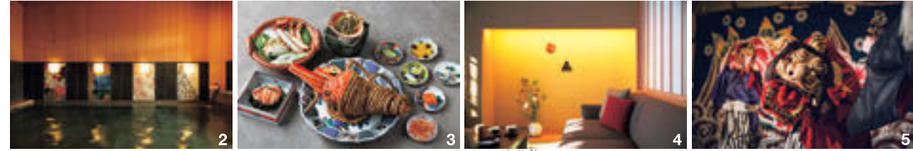
1.1800年代前半の文政年間に建てられた由緒ある建物は、修復、改装されている。庭に佇む茶室「患惟庵」では茶の湯の体験も可能だ 2.大浴場の内湯には陶芸作家による大きなアートパネルが。「色絵」「青手」「赤絵」「藍九谷」の伝統的な4種の九谷焼様式で描かれている 3.解禁となった活蟹をたっぷり1.5杯使った「ひとり蟹会席」。地元の九谷焼作家たちの器でいただく 4.全48の「ご当地部屋」のうち、18室が温泉露天風呂付き 5.加賀百万石の勇士華麗な武家文化を象徴する加賀獅子舞。両眼が鋭く左右に広がった「八方睨」と呼ばれる独特の風貌は、一度見たら忘れられないほどのインパクト