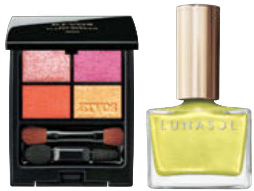
(左)ミネラルクラッシュシャドウ イノセントブルーム ¥4,620 (24年1/5限定発売) / エトヴォス (右)ルナソル ネイルポリッシュ EX45 ¥2,200 (24年2/9限定発売) / カネボウ化粧品

普段は人やものごとと深く関わることを好む蠍座だけれど、2024年前半は色々なタイプの人と軽やかに交流するのが吉。5月まではお誘いも多く、ピンクやオレンジ、ライムグリーン等の明るい色を身につけて、フットワーク軽く参加してみよう。オープンマインドでいるほどに、意外な人物との出会いや新しい経験を引き寄せ、蠍座の価値観や可能性を広げてくれるはず。6月以降は前半に出会った人やものごとにも、深く関わっていくことに!?