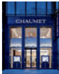
銀座中央通りで存在感を放つ「ショーメ」