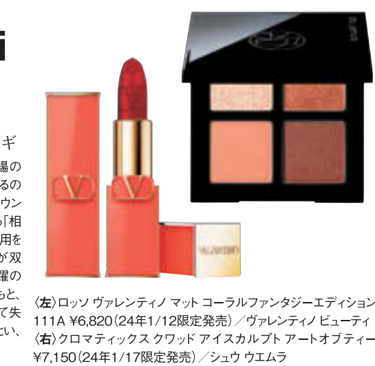
(左)ロッシ ヴァレントー マット コーラルファンタジーエディション 111A ¥6,820 (24年1/12限定発売) / ヴァレントー ビューティ (右)クロマティックス クワッド アイスカルプト アートオブティアー ¥7,150 (24年1/17限定発売) / シェウ ウエムラ

2024年の双子座は、年長者や立場のある人と縁がありそう。運氣を左右するのは「相手への配慮」。落ちついたブラウンの目元で、表面的な会話の先にある「相手の本心」を深読みしよう。周囲の信用を得ることで、幸運と拡大の星・木星が双子座に到来する5月26日以降は飛躍のステージへ。上司や先輩の協力のもと、やりやすいことができるはず。年間通して失言には注意。唇に深みのある赤をまとい、言葉を選んで話すことを心がけて。