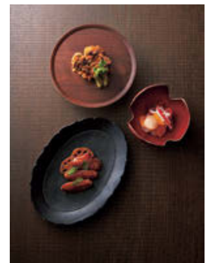
レストランでは、日本各地の郷土料理を現地で調達した食材を使用しながら現代的に再編集し提供。「OGATA」がデザインした美しい食器にも美意識が宿る。

口の手水鉢をはじめ、漆喰の壁、手作業で削り出した階段の一段一段まで、伝統的なフランスの建築物に日本の伝統を織り交ぜしつらえた空間は普遍的な美を宿している。まさに集大成とも言える同館の起点について、日本の暮らしの様式を探究・再構築することは、世界のどこであれ未来にも通ずる生き方の解になるのでは、という問いであると緒方は書籍に綴っている。その信念が「OGATA」の稀有な魅力として世界に伝播し始めている。ページを捲るたびに、そんな兆しを感じずにはいられない。