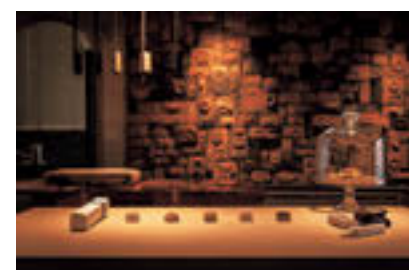
壁面に陶器の菓子型が敷き詰められた茶と和菓子のブティック。「HIGASHIYA」の和菓子を象徴する「ひと口菓子」のほか、洋菓子文化の影響を受けた新たな菓子も並び