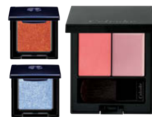
(左)エレガンスラズル アイカラー 上:55,下:51 各 ¥2,310 (24年1/18発売) / エレガンス コスメティクス (右)ポリフォニック ブラッシュ 01 ¥5,390 (24年1/1発売) / セルヴォーク

身近な人たちのために、蟹座はここ数年、自分のことは後回しでがんばってきたはず。2024年は肩の荷が下りて、自身のごとに目が向きそう。上半期は趣味の集まりや推し活など、立場を越えた人たちの気楽な関係に幸運が。グレーベージュや水色を身につけて、色々なタイプの人と交流を楽しみたい。6月以降は、溜まった疲れを癒やすのにいいタイミング。テラコッタ系のカラーで鋭気を養いながら、一人温泉や、何もしない休日を満喫して。