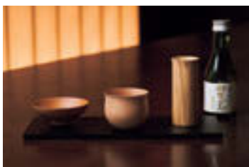
夕食時には違う形の器で飲み比べができる

手業のひとつき 「山中塗の木地師があつらえた無垢の酒器で日本酒を味わう体験」 期間: 2024年2月29日 までの平日 ※除外日: 12月28日~1月5日 時間: 宿泊初日 11:00AM~1:00PM~/3:00PM~のいずれか90分 場所: 工房なかじま(現地集合解散) 内容: 木地師の業を見学、酒器(器は完成後、ご自宅へ配送) 料金: 1名 12,000円(税込み、宿泊費別) 1日2組4名(1組あたり1名~4名) 予約: 公式サイトにて7日前までに要予約(事前に宿泊予約が必要)