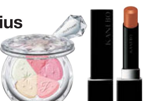
(左)ジルスチュアート ブルーム ミックスブラッシュ コンパクト スターライトブリック 26 ¥4,620 (24年1/5限定発売) / ジルスチュアート ビューティ (右)カネボウ ルージュスターヴェイブラント V10 ¥4,620 (24年1/19発売) / カネボウインターナショナルDiv.

2024年の射手座は、身体や生活全般の「メンテナンス」がテーマ。たとえば早起きしたら仕事の効率が上がった、間食をやめたら自然に痩せたなど、小さな努力が結果として返ってきやすい。ライトブラウンやベビーピンクをお守りに、今まで放置していた不調や、苦手なことに向き合おう。5月までに生活の土台が整うと、6月以降は運氣が安定して、特に対人運が上昇する気配。軽やかなミントグリーンを身につけて、良い縁を引き寄せて。