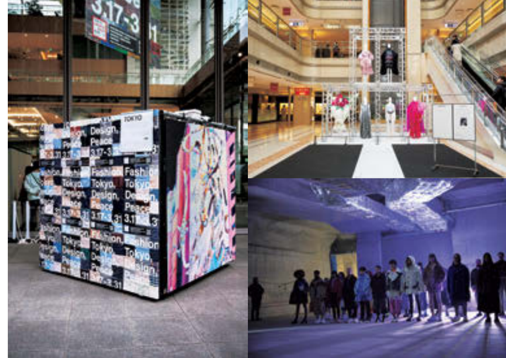
ファッションショーや展示などさまざまなコンテンツで盛り上がりを見せた昨年のTCSの様子