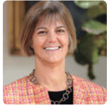
ジュリア・ロングボトム Julia Longbottom 1963年生まれ。1986年にケンブリッジ大学卒業後、英国外務省に入省。1990年～1993年に駐日英国外務省二等書記官、2012年～2016年に駐日英国外務省公使として東京に駐在する。2016年～2020年に英国外務省領事局長、2020年に英国外務省コロナウイルス対策本部長を務める。2021年3月から現職。日英の外交関係で初となる女性の駐日大使。

ことができる。日本の女性の中には、置かれた環境を常識と捉え、差別されていることを十分に理解していない人もいます。社会が女性の声に耳を傾け、変わっていくためには、給与格差やハラスメントの経験などについて、お互いに話したり支援を求めたりしましょう。女性の運命として受け入れないでください。自信を持って、自分の未来を築いてください。