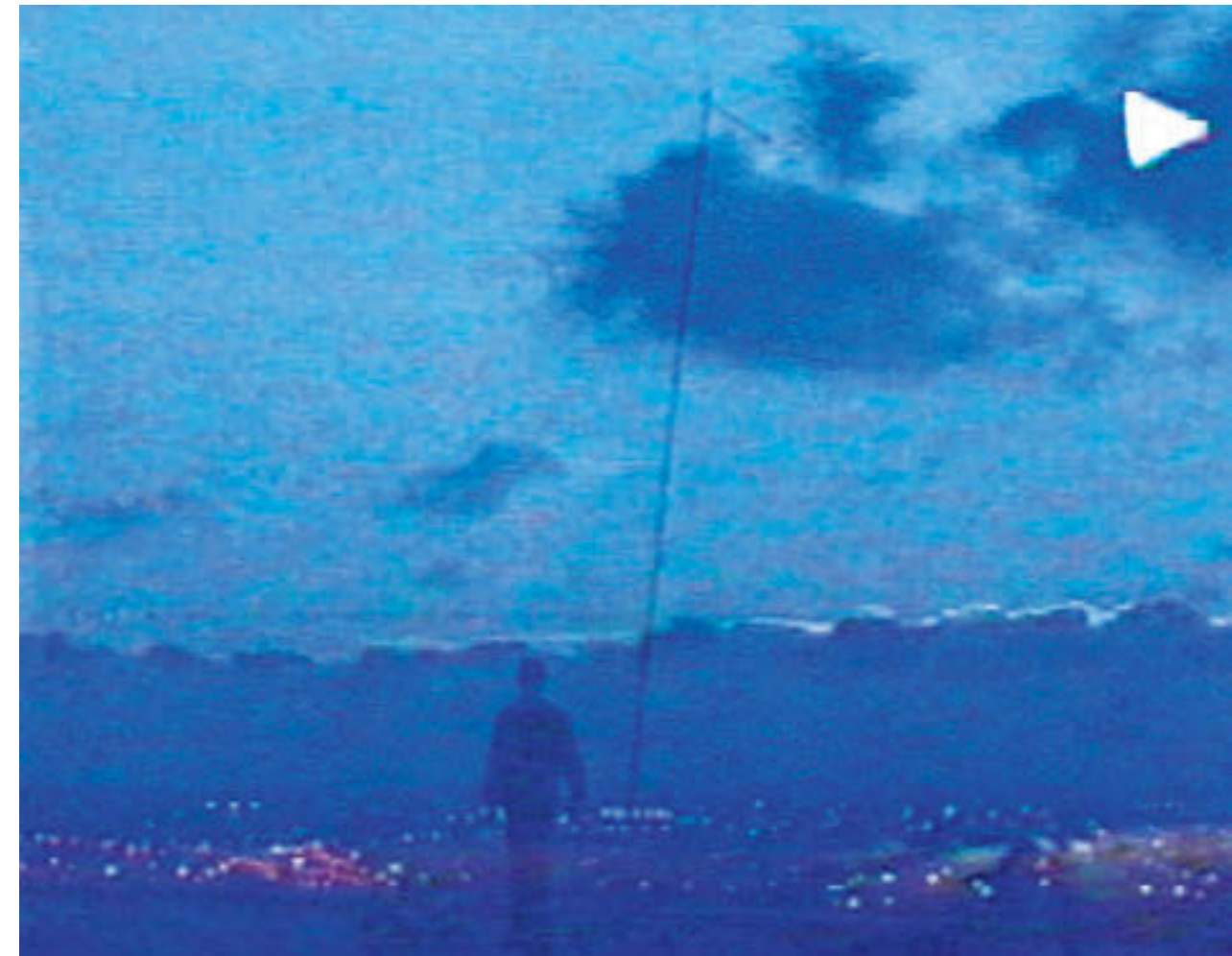
本展は、フォンダシオン ルイ・ヴィトンが所蔵する選りすぐりのコレクションを世界的に紹介する「Hors-les-murs(壁を越えて)」プログラムの一環として企画された。このプログラムは東京のほか、ミュンヘン、ヴェネツィア、北京、ソウル、大阪のエスパス ルイ・ヴィトンで展開されている。

Fiorucci Made Me Hardcore,1999, Film Still