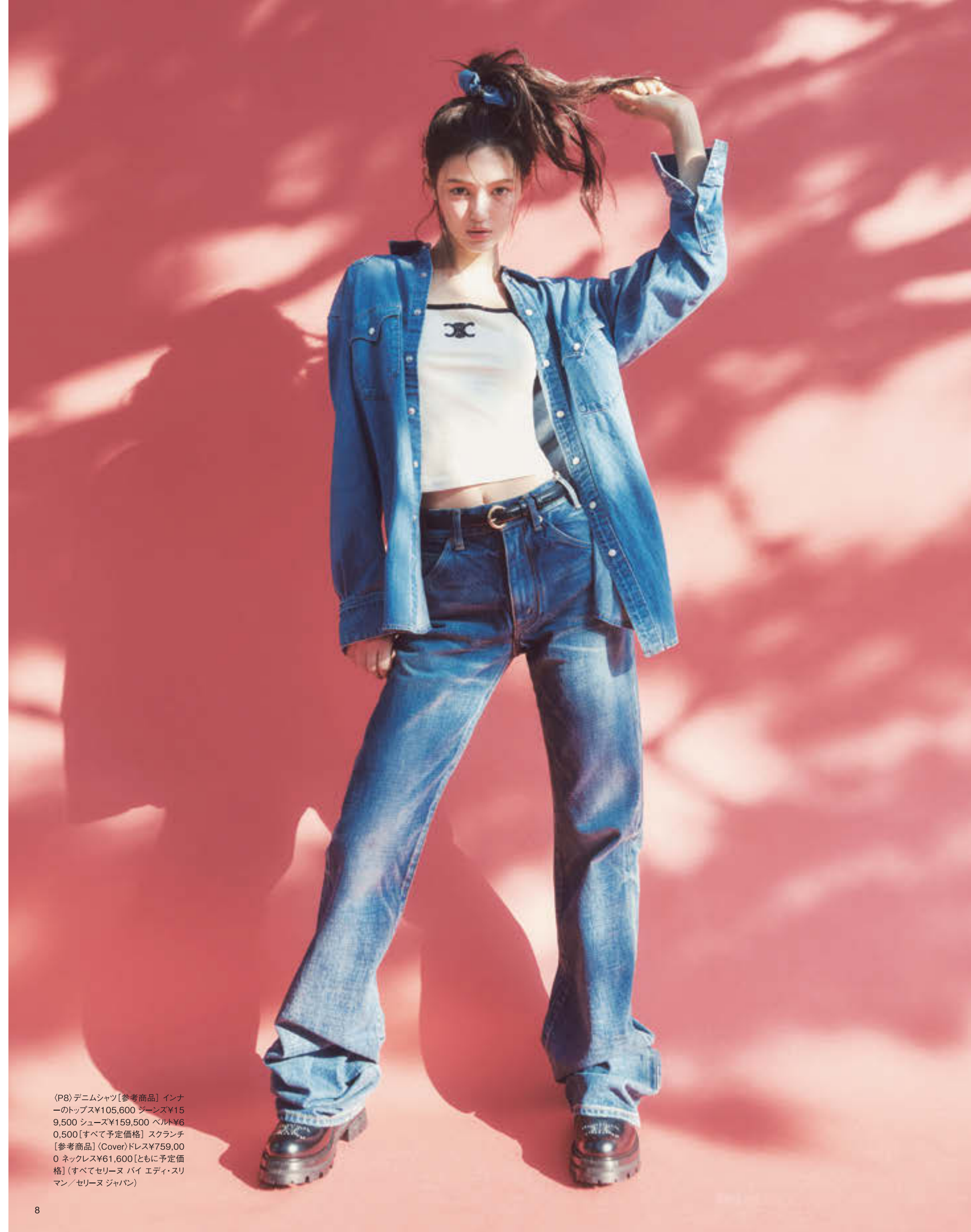
(P8) デニムジャケット[参考商品] インナーのトップス¥105,600 ジーンズ¥159,500 シューズ¥159,500 ベルト¥60,500 [すべて予定価格] ス克蘭チ[参考商品] (Cover)ドレス¥759,000 ネックレス¥61,600 [ともに予定価格] (すべてセリーヌ バイ エディ・スリマン/セリーヌ ジャパン)

NewJeansが5月には韓国で、6月には日本でダブル・シングルをリリースしましたね。音楽、雰囲気、スタイリング等を含めて、今回の活動が最も楽しみです。久しぶりのカムバックでもあり、韓国を超えて海外からも送ってくれる愛に応える最初の一步として、日本公式デビューは意味がとても大きいです。NewJeansは私達だけのカラーを持ちながら新しい挑戦をする為に、いつも努力してきました。新しくお披露目するNewJeansの音楽が皆さんの心を動かし、長く愛される事が出来たら嬉しいです。