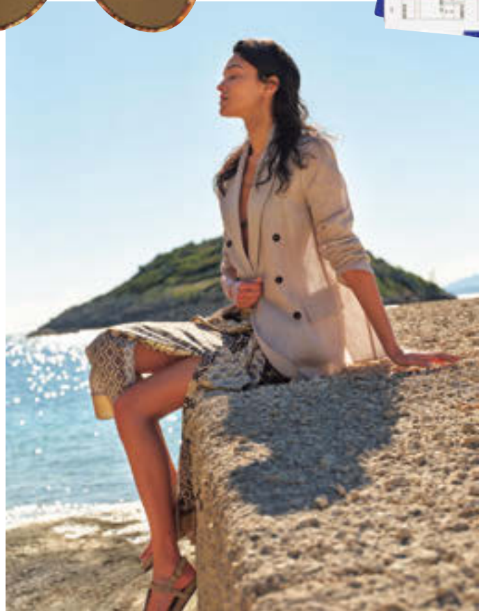
Brunello Cucinelli オーガジーのダブルジャケットにエスニック柄が上品なサロンスカートをON。リ ラックス感のある大人のリゾートスタイルを演出。ジャケット¥622,600、スカート¥375,100(ともにブル ネロ クチネリ/ブルネロ クチネリ ジャパン)