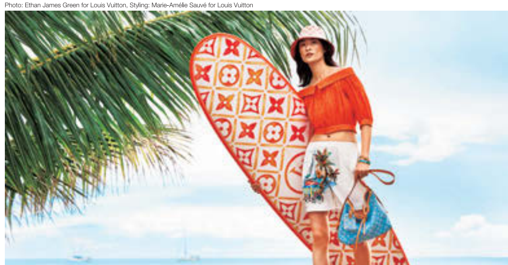
Louis Vuitton 水彩画風のモノグラム・フラワー タイル パターンをあしらったサーフボードもお目見え。ビーチの視線集中間違いなし! サーフボード ¥1,925,000、トップス¥364,100、ショートパンツ[参考商品]、バッグ¥469,700、帽子¥104,500(すべてルイ・ヴィトン/ルイ・ヴィトン クライアントサービス)