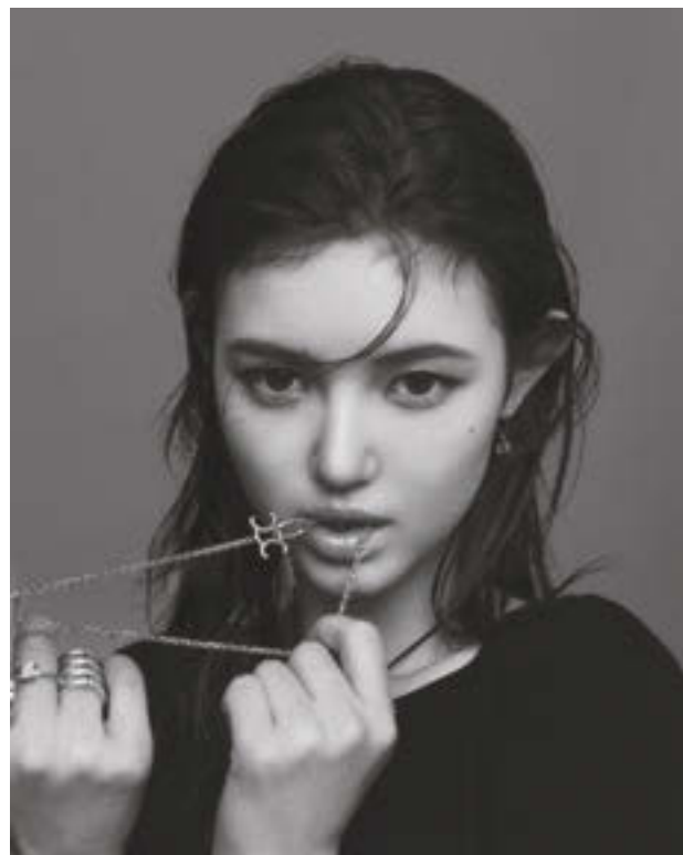
イヤリング¥69,300 ネックレス¥83,600 リング(中指)¥56,100 (薬指)¥74,800 [すべて予定価格] トップス[参考商品] (すべてセリーヌ バイ エディ・スリマン/セリーヌ ジャパン)

2022年にデビューし、瞬く間に世界的なブレイクを果たした韓国の5人組ガールズグループ「NewJeans(ニュージーンズ)」。 そのメンバーの中でもひととき存在感を放つ、透明感溢れる美貌の持ち主がDANIELLE(ダニエル)だ。世界的なトップブランド「セリーヌ」のグローバル・アンバサダーにこの春就任したことで一躍話題に。グループの日本公式デビューや東京ドームでの単独公演にも全力で取り組む彼女が、その熱い思いを語る。