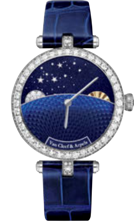
Van Cleef & Arpels