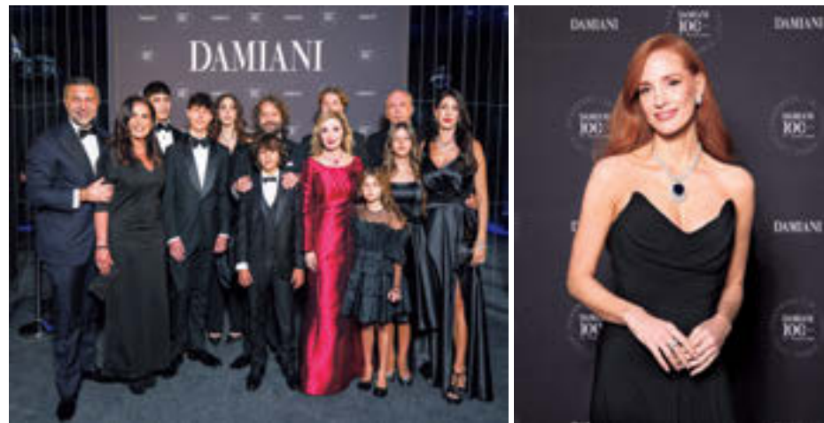
(左)創業100周年を記念したガラディナーもミラノで開催。現在、ブランドで活躍する世代、そして未来を担う次世代が集結した「ダミアニー」の創業家ファミリー (右)上)ガラディナーにはダミアニーファミリーの友人で女優のジェシカ・チャステインが登場 (右下)日本からは女優の今田美桜の姿も