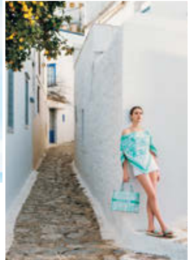
Dior 「ディオリエラ」カプセルコレクションから、ハッピーなエネルギーに満ちたアイテムが絶々登場。トップス ¥140,000[参考価格]、ショートパンツ¥175,000[参考価格]、バッグ¥445,000、サンダル¥134,000[参考価格](すべてディオール/クリスチャン ディオール)