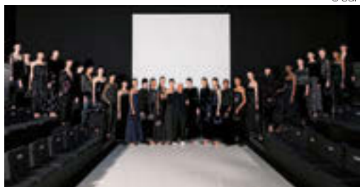
2月にミラノで開催された2024秋冬コレクション会場で、登場したモデルたちと

それがいつの時代にあってもブレない、アルマーニのスタイルを見せられる理由なのだと思います。