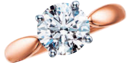
Tiffany & Co.