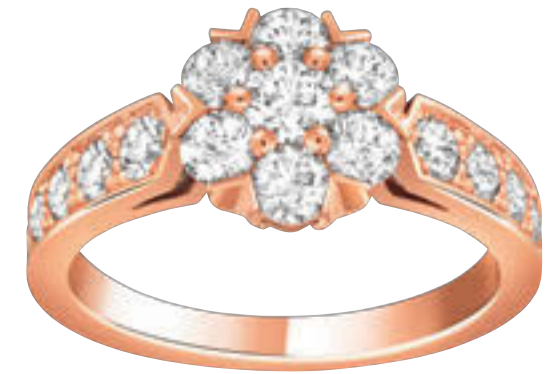
Van Cleef & Arpels