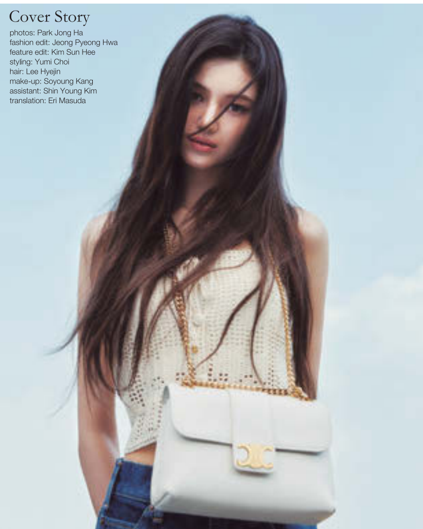
トップス¥445,500 ジーンズ¥159,000 バッグ¥495,000 ネックレス¥61,600 [すべて予定価格] (すべてセリーヌ バイ エディ・スリマン/セリーヌ ジャパン)

fashion edit: Jeong Pyeong Hwa feature edit: Kim Sun Hee styling: Yumi Choi hair: Lee Hyejin make-up: Soyoung Kang assistant: Shin Young Kim translation: Eri Masuda