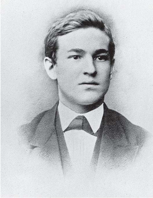
3 | Carl Duisberg als Abiturient 1877

messung etc. Das Ende der Schule empfand Duisberg als Befreiung: «Ich und meine Compenärer mit mir», schrieb er Jahre später, als es um die Reform des naturwissenschaftlichen Unterrichts an den Gymnasien ging, «wir haben uns seinerzeit wie Rohrspatzen gefreut, als wir fertig waren und die ekelhafte Schule verlassen konnten.» 47