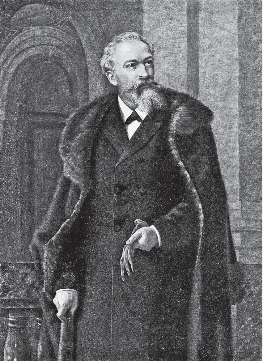
7 | Carl Rumpff, undatiertes Gemälde (1880er Jahre)