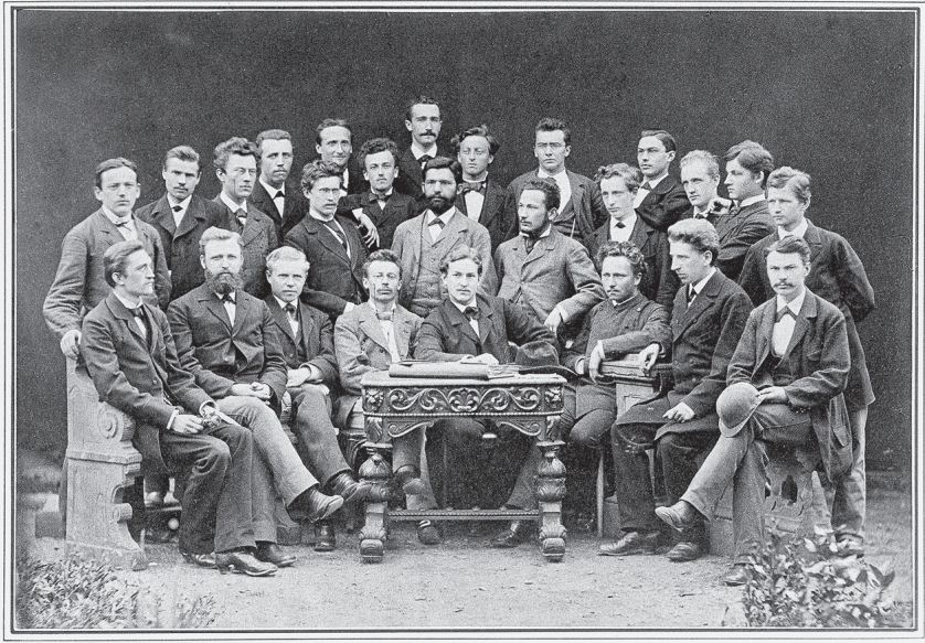
4 | Der Naturwissenschaftliche Verein zu Jena, Sommersemester 1881