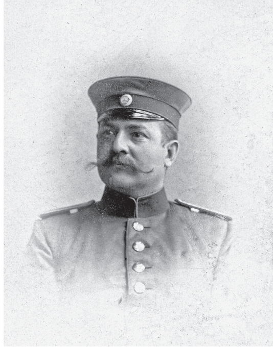
6 | Carl Duisberg als Einjährig-Freiwilliger, 1883

es ihm schwerfiel, sich im Zweifelsfall unterzuordnen. Bei der Einstellung von Chemikern für die Farbenfabriken schätzte er ein Reserveoffizierspatent später allein deshalb, weil der betreffende Kandidat den Umgang mit Menschen, insbesondere mit Untergebenen gelernt habe.