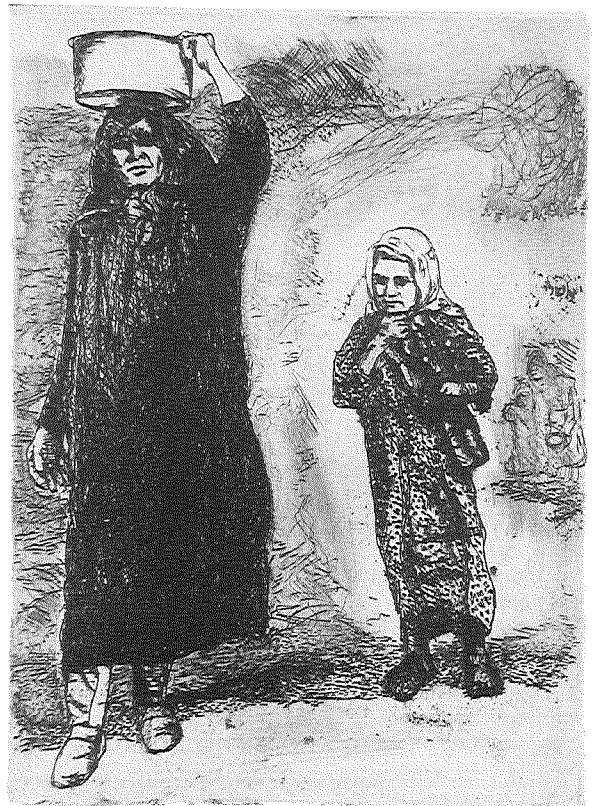
24 שם, עמ' 169.

מה שריגש את שפרינצק לא פחות מן המראה העלוב של הילדים הוא כמיהתם למילה ולליטוף של חיבה. למקרא דברים אלה אין אדם בן ימינו - אמנם ממרחק של זמן וממצב חברתי שונה לחלוטין - יכול להימנע מן השאלה אם לא היה אפשר לנהוג בילדים אלה קצת אחרת. והשאלה אינה מופנית אל החברה, אלא דווקא אל ההורים: האם משפחות חרוצות ובעלות תושייה אלה, שידעו להסתדר בתנאים הקשים שנכפו עליהן במושבות ואפילו לחסוך מעט כסף לשם הבטחת עתידן, לא יכלו למצוא עצה כיצד לנהוג בדרך רחומה יותר בילדיהן? התשובה על כך נעוצה בוודאי בתרבות. תמותת תינוקות הייתה נפוצה כאמור בקרב יהודי תימן, אך אין בכך הסבר ממצה. לצורך השגחה על ילדים אלה דרושה הייתה קודם כול התארגנות של העדה במקום מגוריה. אולם כנראה לא היה לציבור זה כושר התארגנות מעבר למסגרת המשפחתית, ועל כך עמדו שפרינצק ואחרים אשר תיארו את המצב בעדה התימנית.