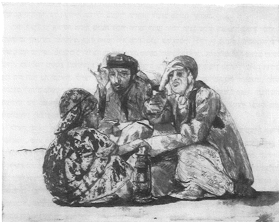
ציפייה, תחריט נחושת מעשה ידי איתמר סיאני

מן ההכרה כי המדובר בחברה של יהודי תימן ולא בקבוצה נבחרת של חלוצים ממזרח אירופה נבעה המסקנה כי העלייה מתימן, יהיו ממדיה אשר יהיו, היא בעלת אופי סוציולוגי של הגירה. יבנאלי הוא שהגדיר עלייה זו כהמונית, על כל המשתמע מכך מבחינת הרכב העולים, כלומר גילם,