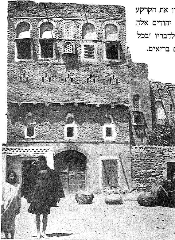
למעלה: בית יהודים בצנעא מימין: סוחר יהודי צעיר. המפתח על זהו מסמל את מעמדו

מסקנה זו, המזכירה את הבחנתו של אחד העם בין 'שלילת הגלות הסובייקטיבית' לבין זו ה'אובייקטיבית', כלומר בין התחושה של הגלות לבין ההכרה כי אפשר להמשיך ולהתקיים בה, עוררה אצל יבנאלי נקיפות מצפון כלפי יהודים אלה והרהורי ספק באשר למטרות שליחותו. בעמדו מול אלה אשר 'מתפרנסים מיגיע כפיהם' עלתה בו לפעמים המחשבה: 'כיצד הנני משבח לפניהם את ארץ-ישראל ואת עבודת השדה, וכיצד הם יעברו מסביבה כזו ומעולם כזה אל ארץ-ישראל, אל עולם הנתינה והתמיכה; כי פה אין מקבלים צדקה'. כלומר חל אצלו מעין היפוך יוצרות ערכי: החיים בגלות תימן, שהם חיי עבודה, נראו בעיניו חיוביים יותר מאלה שבארץ-ישראל, המבוססים על תמיכה. יתרה מזו, גם מורא השכנים,