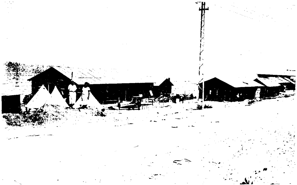
מחנה פלוגת תל-אביב של גדוד העבודה (כיום ברחוב הירקון), 1923

בזהירות את גבולותיה של יכולת הפעולה. גבולות אלו צרים הרבה יותר מהצפיות הדרוכות ומלהט הנפש. מי שאיננו יכול לרסן את השאיפה לתקן פני עולם כאן ועכשיו, נחבט בגבולות הצרים הללו. את תהליכי הליקוידציה שהוליכו להסתלקות מהרעיון הציוני הכיר בן-גוריון עוד בתקופת העלייה השנייה, ומאוחר יותר בעת שליחתו לאירופה, ב־1919-1921. בארצות-הברית, במזרח-אירופה ובאנגליה הוא פגש צעירים יהודים רבים, שנטו קודם לציונות הסוציאליסטית ועברו בעקבות המהפכה הרוסית תהליכי השמאלה. כתהליך זה התרחקו מהציונות, שנתפסה בעיניהם כמעשה שולי, שמשמעותו האוניברסלית קטנה, אך הוא מחייב מאמץ אישי וקורבן רב-שנים. ההשוואה בין ההשתתפות במהפכה חברתית חובקת עולם, שבה ממילא ימצא פתרון לבעיית היהודים לבין המאמץ המחיש למען הקמת יישוב יהודי באסיה הנידחת — הובילה צעירים רבים להכרעה נגד הציונות.