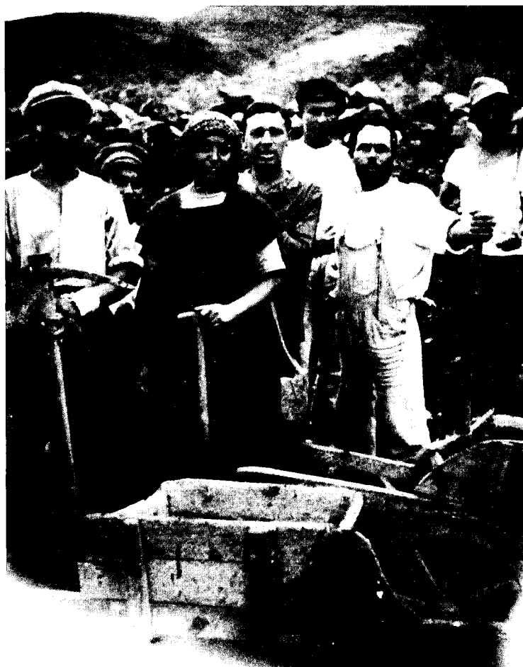
חברי גדוד העבודה במגדל, בסלילת כביש טבריה-טבחזה, 1921