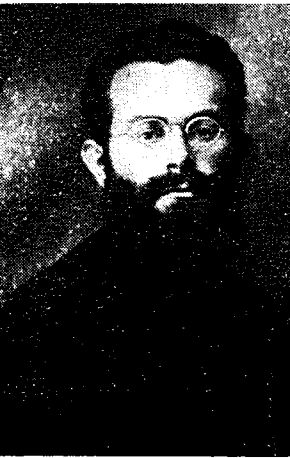
חנוך חכל, 1925

ניתן היה לערער על פסק דינו. 57 הוועדה נשאלה חמש שאלות המתייחסות לחמש פעולות של 'הקיבוץ החשאי'. 58 נראה שהשאלות נוסחו בידי בן-גוריון, בהסכמה עם אנשי הימין בגדוד. מכל מקום הן לא כללו עניינים שביורום עלול היה לפגוע בכוחות החדשים שנטלו עתה על עצמם את הנהגת הימין.