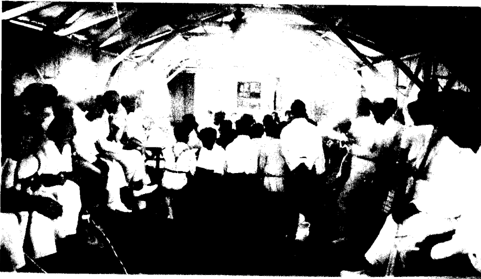
יצחק בן-צבי מרצה בפני אנשי גדוד העבודה בצריף פלוגת רטיסבון, ירושלים 1923

של אנשי העלייה השלישית — כבר היתה חשודה מראש בעיני פקידות השלטון). זיהוי יוזמיו של קשר זה עם גדוד העבודה ועם ההסתדרות נראה כעלול לגרום לתוצאות שאין לשערן. בן-גוריון סבר אפוא, כי יתרונות גדוד העבודה כארגון חזק ורב-יוקרה, המבקש להיות נושא הדגל של ההגשמה הציונית בארץ, הם חסרונותיו. השעה טרם הוכשרה למצבור רב-עוצמה זה של רעיון, ארגון ואנשים מסורים. דווקא משום שהרעיון צודק, הארגון מגובש והאנשים מוכשרים יש להיערך ולהתמודד נגדם, ומוקד ההתמודדות הוא קבלת מרותה המלאה והמוחלטת של ההסתדרות.