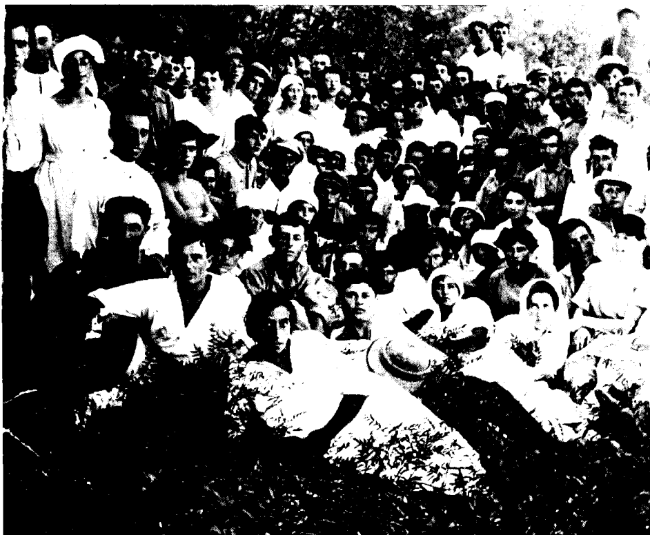
אנשי גדוד העבודה במגדל, 1920