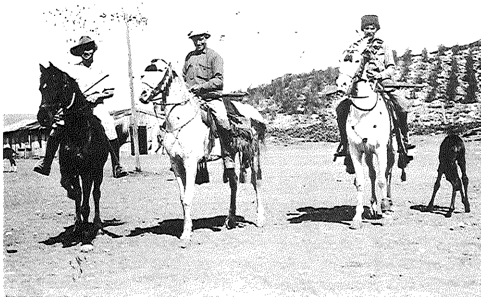
שומרים, אנשי גדוד העבודה

העבודה. חשיבות העדות לא היתה בגילויים נוספים ב'עניין המרכבה', שהיה ממילא עניין שולי, אלא בהודאה בקיומו של ארגון חשאי הפועל באופן עצמאי.