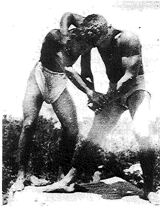
אנשי הגרוד יצחק שדה ויצחק רטנר בהיאבקות (1924-1925)