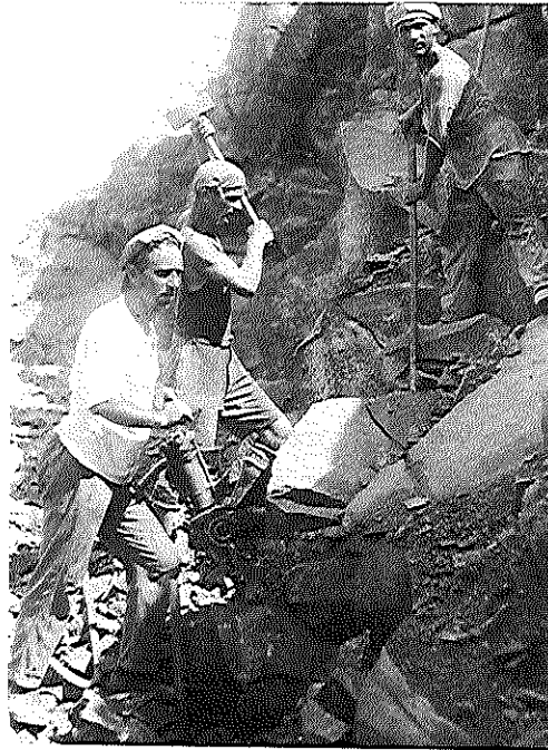
חבורה מגדוד העבודה במחצבה בירושלים

היחיד ששני הצדדים הנצים יכלו לראות בו אחד משלהם, תוך מודעות למחויבותו המקבילה לקבוצה היריבה. על-אף שלא התמנה לוועדה יושב-ראש, מעמדו של בן-צבי, נסיונו הציבורי הרב, ההיכרות הקרובה שלו עם הדמויות הפועלות והזיקה שלו לנושא הפכו אותו לאיש הדומיננטי. ככל הנראה, בן-צבי ניהל את רוב הישיבות, והוא שגיבש את תשובות הוועדה לוועד הפועל. 39