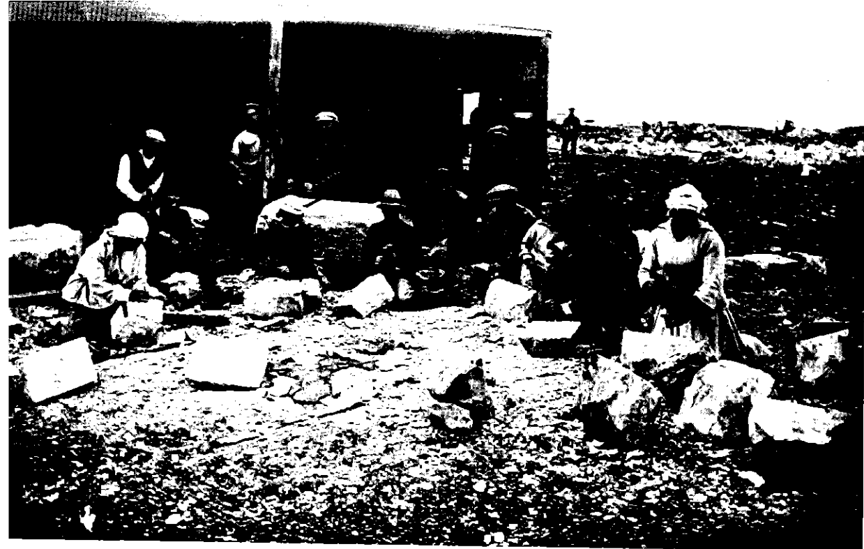
פלוגת ירושלים בעבודת סיתות במחצבת ראטיסבון (1924)

ל'אוריינטאציה אידיאולוגית חדשה [בגדוד] לרגלי שיתוק המחשבה התיאורטית בגדוד במשך כל זמן קיומו. שיתוק מחשבה זה שלט בגדוד למרות שתחושת המשבר הקומונוטארי הייתה משותפת לחלקים רבים בו, ואחה תחושת הבדידות במסגרת היישוב המתהווה בארץ ואפילו בקרב ההסתדרות, שלא גילתה, לפחות לפי הרגשתם, הבנה לדמיון הראדיקאלי הקומונוטארי. אך גם נוכח האכזבות שליוו את גיאות העלייה הרביעית וגם נוכח האכזבה מן המשבר שבא בעקבות גיאות זו, בשנים 1926–1927, לא היה ערעור בגדוד על עצם השיטה הקומונוטארית שעיצב לעצמו, שיטה שיחדה אותו מכל הנסיונות הקומונוטאריים האחרים בארץ. אכן המועצה של הגדוד שהתקיימה בראש-השנה תרפ"ו, קבעה כי