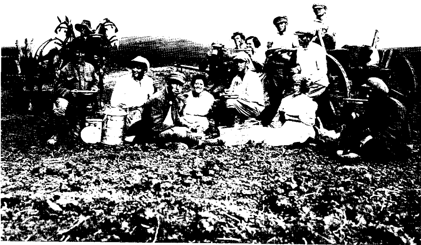
חברי גדוד העבודה בתל-יוסף (1924)