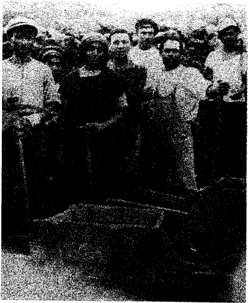
פלוגת מגדל ליד המחצבה

המשרד צריך להיות לא של קיבוצים ואף לא של הסתדרות מקצועית, אלא של הסתדרות העובדים כולה. . . היא מחלקת ההסתדרות הכללית לעבודות קבלנות. המועצות העירוניות [היינו, מועצות הפועלים] תפקחנה על פעולות סניפי המשרד. להסתדרות המקצועית המקיפה יהיה מרכז נבחר שהוא אשר ידאג לאיגוד והגנת העובד.