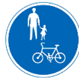
道路標識 (自転車および歩行者専用)