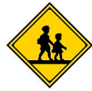
がっこう まちまちな 学校、幼稚園、 保育所などあり