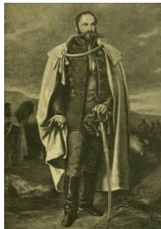
Dessewffy Arisztid portréja (Than Mór festménye)

Az akadémisták kiemelten ápolták számos történelmi személyiség emlékét. Ezek közül kiemelkedtek azok, akik kapcsolódtak is a jogakadémiához. Így az egykori eperjesi collegiumi diákok (!), Thököly Imre fejedelem és Kossuth Lajos emlékét, valamint a jogakadémia nagy pártfogójának, a Dessewffy-családnak híres mártírját, Dessewffy Arisztid grófot, az „ Aradi Tizenhárom ” egyikét is hasonlóan tisztelték, s akinek híres portréja, Than Mór alkotása, a miskolci jogakadémia dékáni szobáját is díszítette.