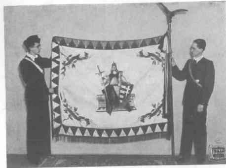
Az eperjesi Joghallgatók Testületének Miskolcra átmentett zászlaja.

Az eperjesi akadémisták, és későbbi miskolci követőik sorsa azt bizonyítja, hogy a magyar történelem sorsfordító pillanataiban tartották is magukat e fogadalmukhoz.